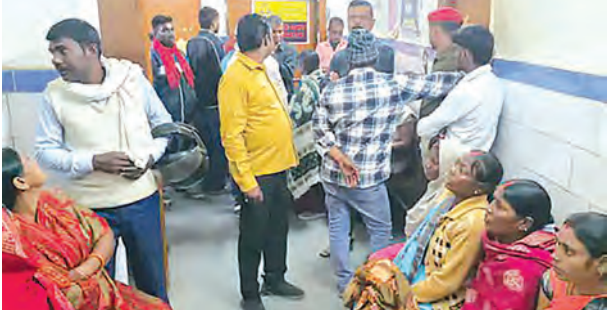
एसटीवी संवाददाता | औरंगाबाद