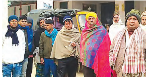
निज सं. | दाउदनगर (औरंगाबाद)

हसपुरा बाजार में जाम की समस्या अब विकराल रूप ले चुकी है। सड़क संकीर्ण होने और रोड पर लगातार बढ़ते अतिक्रमण के कारण यहां एक-दो दिन नहीं बल्कि लगभग हर दिन जाम की स्थिति बनी रहती है। सोमवार को पुरानी थाना रोड मोड़ के पास नाला उड़ाही का कार्य चलने से हालात और भी बिगड़ गए। सफाई कर्मियों द्वारा नाले से निकाले गए मलबे को सड़क पर रखने के बाद बाजार में घंटों तक जाम लगा रहा। छोटे-बड़े वाहन घंटों तक रोकते हुए आगे बढ़ते नजर आए। स्थानीय