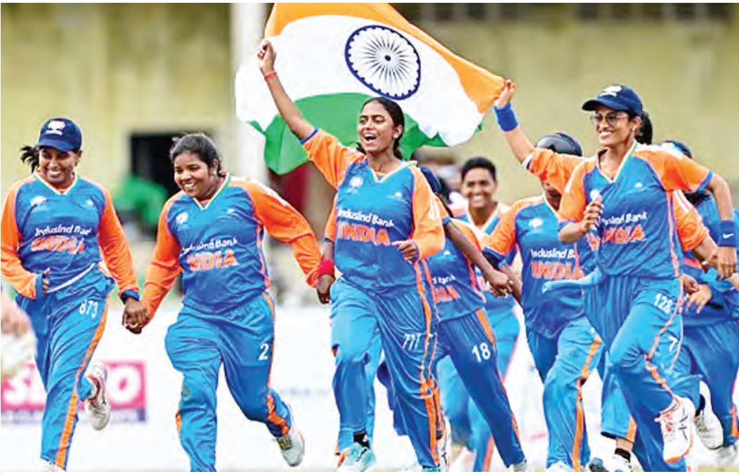
क्रिकेट फॉर ब्लाइंड :