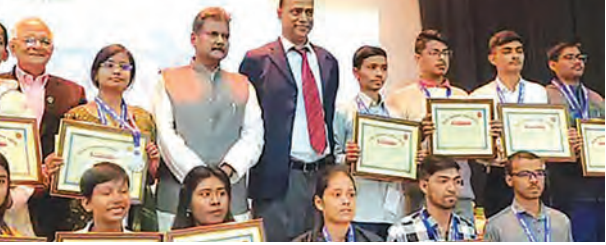
निज संवाददाता | पटना

बिहार बोर्ड 10वीं-12वीं के 151 टॉपर्स सम्मानित शिक्षा मंत्री ने दिया सर्टिफिकेट, लैपटॉप, पुरस्कार राशि और स्कॉलरशिप