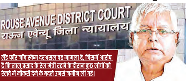
लैंड फॉर जॉब स्कैन दरअसल यह मामला है, जिसमें आरोप है कि लालू प्रसाद के रेल मंत्री रहने के दौरान कुछ लोगों को रेलवे में नौकरी देने के बदले उनसे जमीन ली गई।

लैंड फॉर जॉब स्कैन : आरोप तय करने पर फैसला टला, अब 8 दिसंबर को सुनवाई