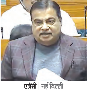
नई दिल्ली

केंद्रीय सड़क परिवहन और राजमार्ग मंत्री नितिन गडकरी ने लोकसभा में गुरुवार को बड़ी घोषणा करते हुए बताया कि देशभर में हाईवे टोल प्लाजा का मौजूदा सिस्टम अगले एक साल के भीतर समाप्त कर दिया जाएगा। इसकी जगह पूरी तरह इलेक्ट्रॉनिक और बैरियर-लेस टोलिंग सिस्टम लागू किया जाएगा, जिससे वाहनों को अब टोल पर रुकना नहीं पड़ेगा। गडकरी ने कहा कि नए टोल सिस्टम का पायलट प्रोजेक्ट देश के 10 स्थानों पर शुरू किया जा चुका है और शुरूआती परीणाम उत्साहजनक हैं। उनका कहना था कि सरकार का लक्ष्य इसे एक वर्ष में पूरे देश में लागू करना है, ताकि सड़क परिवहन तेज, निर्बाध और तकनीक आधारित बन सके। उन्होंने यह भी जानकारी दी कि फिलहाल देशभर में करीब 4,500 हाईवे प्रोजेक्ट पर काम चल रहा है, जिनकी कुल लागत लगभग 10 लाख करोड़ रुपये तक पहुंचती है। पहले टोल वसूली के लिए वाहनों को प्लाजा पर रुककर नकद या कार्ड से भुगतान करना पड़ता था। फास्ट टैग आने के बाद यह समय काफी कम हुआ, लेकिन अब अगला कदम उससे भी अधिक उन्नत तकनीक की ओर बढ़