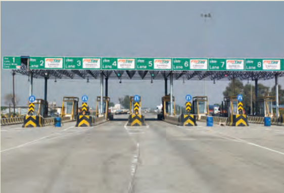
टोल प्लाजा का फोटो

लंबी कतारों से समय और ईंधन की बर्बादी :- राष्ट्रीय राजमार्ग प्राधिकरण (एनएचआई) ने टोल प्लाजा पर ट्रैफिक जाम समाप्त करने के उद्देश्य से फास्टैग प्रणाली लागू की थी,जिसका दावा था कि एक वाहन 10 सेकंड का भी कम समय में टोल बूथ पार कर जाएगा। हालांकि, रजौली टोल प्लाजा पर हकीकत इस दावे से कोसों दूर है। तकनीकी खराबी, स्कैनर का ठीक से काम न करना और ऑपरेटरों की धीमी