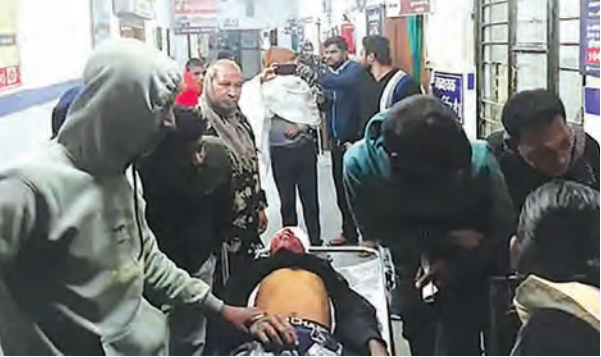
निज संवाददाता | रफीगंज (औरंगाबाद)

विश्व मृदा दिवस के अवसर पर शुक्रवार को जिला मुख्यालय और सभी प्रखंड कृषि कार्यालयों में विशेष जागरूकता कार्यक्रम आयोजित किए गए, जिनमें किसानों को मिट्टी की सेहत, उर्वरक प्रबंधन और जैविक खेती के महत्व के बारे में जानकारी दी गई। कृषि विभाग का कहना है कि इस अभियान से हजारों किसानों को लाभ पहुंचा है। मृदा स्वास्थ्य कार्ड मिलने के बाद किसान संतुलित मात्रा में उर्वरक का उपयोग कर लागत घटा सकते हैं और उत्पादन में वृद्धि कर सकते हैं। विभाग ने आश्वासन दिया है कि बचे हुए सभी नमूनों का विश्लेषण जल्द से जल्द पूरा किया जाएगा ताकि रबी सीजन में कोई किसान वैज्ञानिक खेती के लाभ से वंचित न रह जाए।