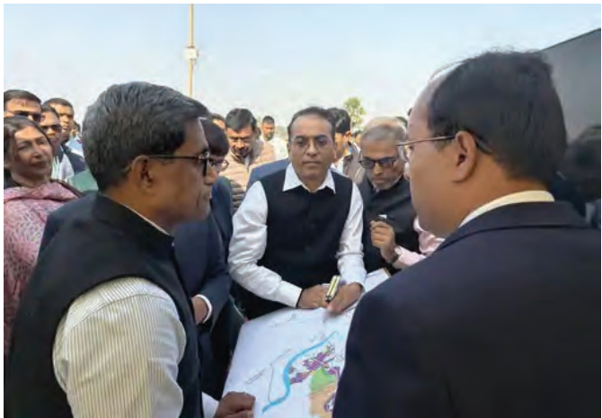
निज संवाददाता। गया / डोभी