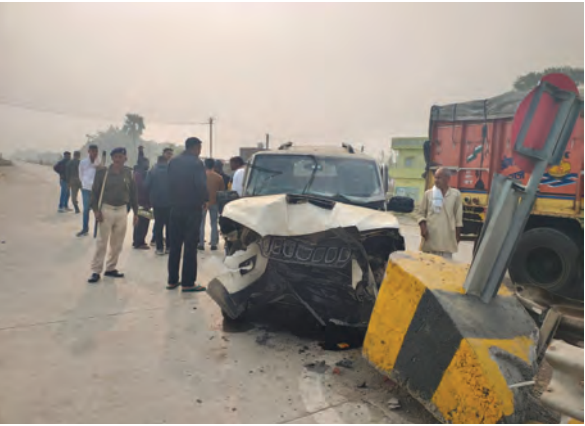
ड्रिवाइडर से टकराई स्कॉर्पियो

दुर्घटनाग्रस्त स्कॉर्पियो में रखे पैसों की लूट:- घटना की सूचना मिलते ही रजौली टोल प्लाजा से कर्मी घटनास्थल पर पहुंचे एवं सड़क पर गंभीर रूप से घायल पड़े दोनों लोगों को एनएचएआई एंबुलेंस से अनुमंडलीय अस्पताल में इलाज हेतु भर्ती कराए।टोल कर्मियों द्वारा