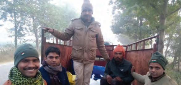
जब्त टेम्पो के साथ उत्पाद बल