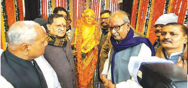
एसवीवी संवाददाता | औरंगाबाद

चोर दूसरे कमरे में रखे बक्से और अटची उठा ले गए। जानकारी के अनुसार पांच बक्से, दो अटची और तीन ट्रॉली सहित जेवरात व