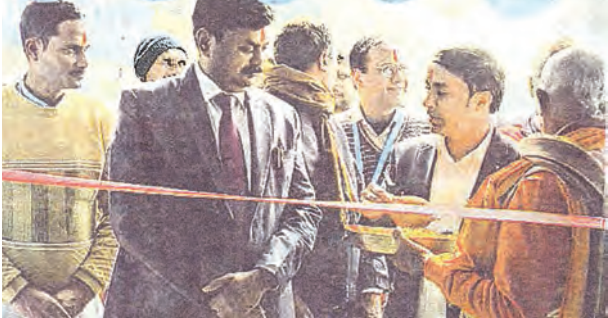
निज संवाददाता | गोह (औरंगाबाद)

हसपुरा (औरंगाबाद)(नि.सं.)। पिछले दो दिनों में मौसम में आए अचानक बदलाव ने हसपुरा सहित पूरे क्षेत्र में ठंड का प्रकोप बढ़ा दिया है। घना कोहरा, पड़ुआ हवा और कड़कड़ाती सर्दी ने आम जनजीवन अस्त-व्यस्त कर रखा है। ठिठुरन इतनी बढ़ गई है कि लोग घरों से निकलने में कठिनाई महसूस कर रहे हैं, लेकिन रोजी-रोटी की मजबूरी उन्हें सड़कों पर उतरने के लिए विवश कर रही है।इस बीच सरकारी स्तर पर अलाव की व्यवस्था न होने के कारण लोगों को कचरा जलाकर आग तापनी पड़ रही है। बस स्टैंड और चौक-चौराहों पर सबसे अधिक परेशानी टेम्पो चालकों और फुटपाथ पर रहने वालों को झेलनी पड़ रही है। सर्द सुबह में टेम्पो चालक बस स्टैंड पर पहुंचते हैं और ठंड से बचने के लिए कचरा इकट्ठा कर अलाव तैयार कर लेते हैं।