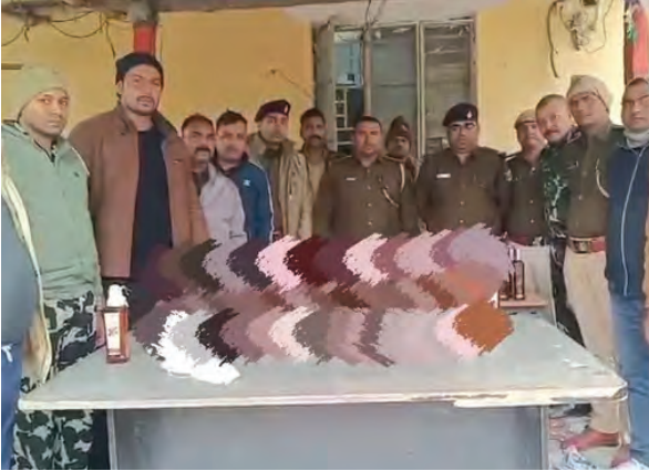
નિજ સંવાદદાતા | ભાગલપુર

जा रहा है। सूचना के आधार पर जब दोन ओटों में बनाए गए हथकड़ी 112 की टीम मौके की ओर बढ़ी, जैसे बॉक्स से 3.75 एमएल व तब तक ओटों ड्राइवर और उसमें 129 बॉतल विदेशी शराब बरामद की। शराब को इस तरह से छिपाया गया था कि सामान्य जांच में इसका पता लगाना मुश्किल था। ओटों से कुल 85.87