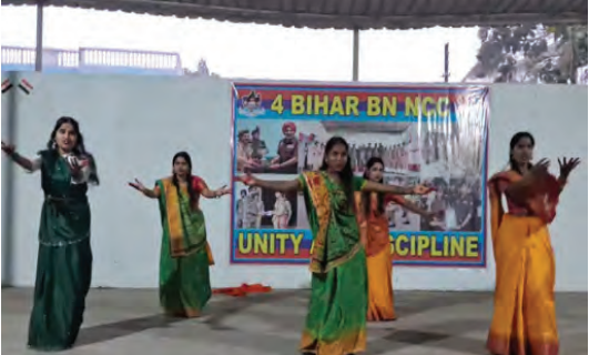
निज संवाददाता। बेगूसराय