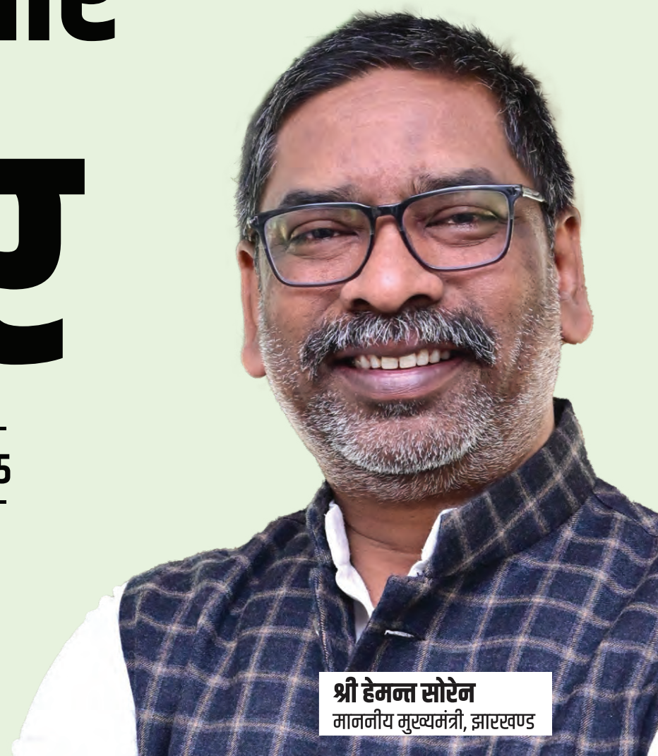
श्री हेमन्त सोरेन माननीय मुख्यमंत्री, झारखण्ड

सूचना एवं जनसम्पर्क विभाग, झारखण्ड सरकार