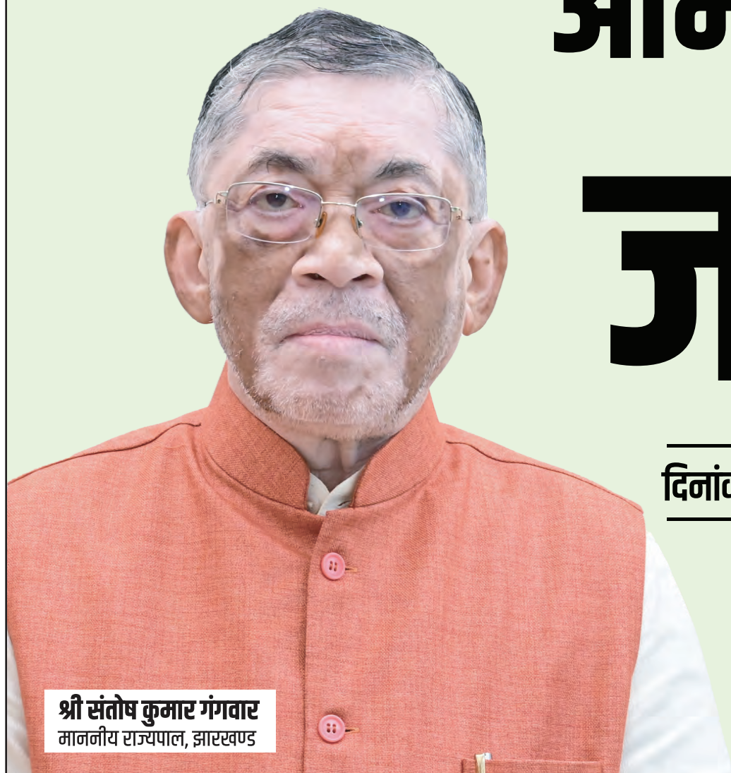
श्री संतोष कुमार गंगवार माननीय राज्यपाल, झारखण्ड