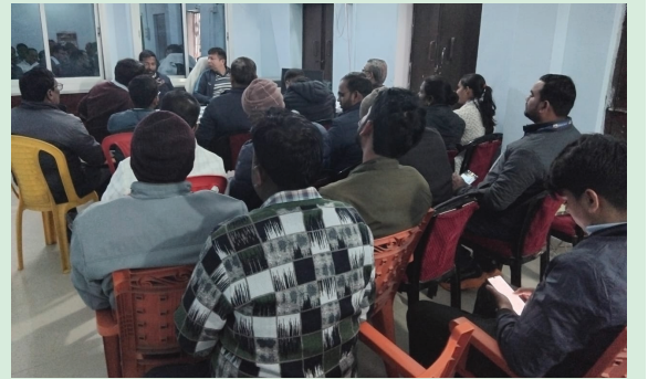
बीएलबीसी की बैठक में शामिल बीडीओ व बैंक कर्मी