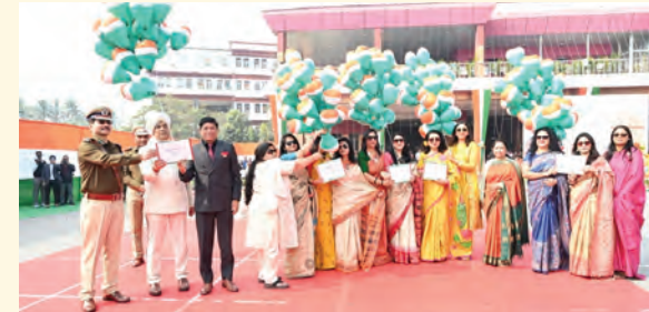
निज संवाददाता। हाजीपुर,पटना