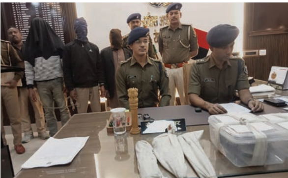
निज संवाददाता। डेहरी। रोहतास