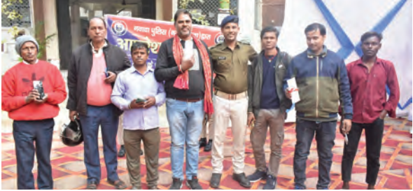
मोबाइल फोन के साथ वास्तविक धारक