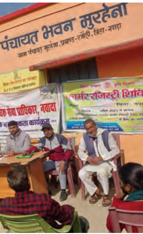
जागरूकता कार्यक्रम में शामिल अधिकारी व ग्रामीण