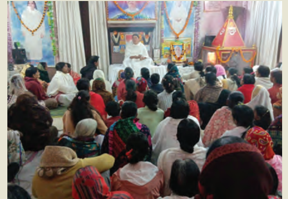
पुण्य स्मृति दिवस मनाती महिलाएं