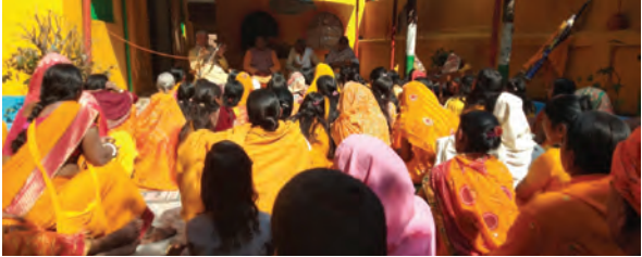
निज संवाददाता। कौआकोल

कारणों से विलंब हुआ है। डीएफओ ने आंदोलित कर्मियों को भरोसा दिलाया कि उच्चाधिकारियों से संवाद स्थापित कर आगामी फरवरी माह तक हर हाल में उनके बकाया वेतन का भुगतान सुनिश्चित करने का प्रयास किया जाएगा।अधिकारी के इस ठोस आश्वासन के बाद केयरटेकरों ने विभाग के गेट से ताला हटया और अपना धरना समाप्त करने की घोषणा की। हालांकि, मजदूरों ने यह भी स्पष्ट कर दिया है कि यदि तय समय सीमा के भीतर उनका भुगतान नहीं होता है, तो वे पुनः बड़े आंदोलन के लिए विश्वास होंगे। फिलहाल, डीएफओ की इस सक्रियता ने वन विभाग में तीन दिनों से चले आ रहे तनावपूर्ण माहौल को शांत कर दिया है।