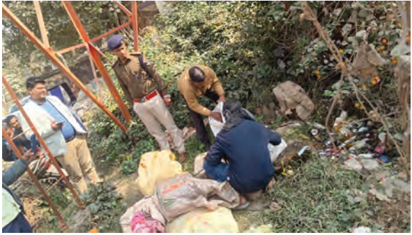
शराब विनष्टीकरण करते जवान व मौजूद सीओ व थानाध्यक्ष

प्रशासनिक सूत्रों के अनुसार, रजौली थाने में दर्ज नौ अलग-अलग मामलों में जब्त की गई लगभग 1630 लीटर महुआ शराब को जमीन में गड़ा खुदकर बहा दिया गया। इसके साथ ही, तीन अन्य मामलों में जब्त की गई 66.375 लीटर विदेशी शराब की बोतलों को भी पूरी तरह विनष्ट कर दिया गया।