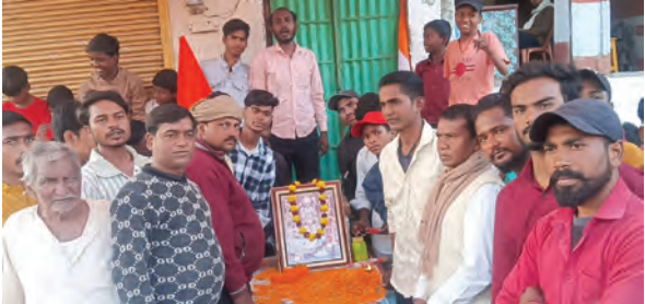
प्राण प्रतिष्ठा वर्षगांठ मनाते श्रीराम भक्त