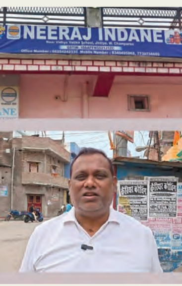
नीरज गैस एजेंसी पर गैस नहीं देने का लगा आरोप