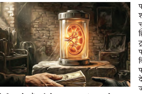
मुझे निकालो, मैं दर्द से तड़प रहा हूँ, तुम परेशान न हो... जेल तो मैं जाऊंगा मगर किसी का नाम नहीं लूंगा। पुलिस ने उसके पास से कुछ कागजात हासिल किए हैं