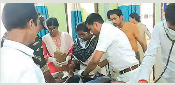
निज संवाददाता | गोह (औरंगाबाद)

जिले के गोह थाना क्षेत्र में मंगलवार दोपहर एक गंभीर सड़क हादसा हुआ, जिसमें बाइक सवार युवक बुरी तरह घायल हो गया। घटना की सूचना मिलते ही डायल 112 की पुलिस टीम मौके पर पहुंची और घायल युवक को तत्काल इलाज के लिए गोह प्राथमिक स्वास्थ्य केंद्र में भर्ती कराया गया। वहां प्राथमिक उपचार के बाद उसकी हालत नाजुक देखते हुए डॉक्टरों ने उसे बेहतर इलाज के लिए मध्य मेडिकल कॉलेज, गया रेफर कर दिया। फिलहाल युवक का इलाज जारी है और उसकी स्थिति गंभीर बताई जा रही है। पुलिस मामले की जांच में जुट गई है तथा हड़बड़ वाहन की पहचान और चालक की तलाश की जा रही है।