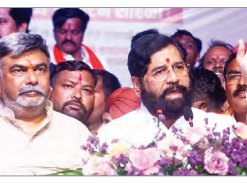
अधिक हिस्सा झोपड़पट्टी है। इन बड़े प्रोजेक्ट्स के लिए बायोमेट्रिक सर्वे और स्ट्रीक मापन के बाद बीएमसी और एमएमआरडीए जैसी संस्थाएं मिलकर काम करेंगी। एकनाथ शिंदे ने बताया मुंबई में नई झोपड़पट्टियों के विस्तार

है। योजना के तहत उन क्षेत्रों को प्राथमिकता दी जाएगी जो कम से कम 50 एकड़ में फैले हैं और जहाँ 51% से