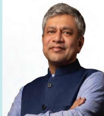
अश्विनी वैष्णव केंद्रीय रेल मंत्री भारत सरकार