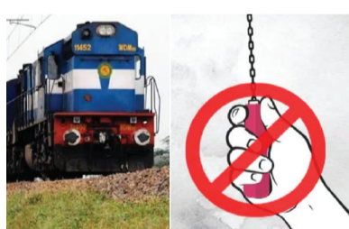
कार्रवाई की गई है।

हाजीपुर। ट्रेनों के समय पालन और यात्रियों की सुरक्षा सुनिश्चित करने के लिए पूर्व मध्य रेल ने मार्च माह में व्यापक अभियान चलाते हुए नियम तोड़ने वालों पर सख्त कार्रवाई की है। 1 मार्च से 15 मार्च 2026 के बीच रेलवे सुरक्षा बल (RPF) की टीमों ने अलग-अलग रेलखंडों पर कार्रवाई करते हुए बड़ी संख्या में लोगों को हिरासत में लिया। रेल प्रशासन के अनुसार, बिना किसी उचित कारण के चैन पुलिंग कर ट्रेनों को अनावश्यक रूप से रोकने की घटनाओं को गंभीरता से लेते हुए "ऑपरेशन समय पालन" चलाया गया। इस अभियान के तहत कुल 514 लोगों को हिरासत में लिया गया और उनसे करीब 1 लाख 46 हजार रुपये जुर्माने के रूप में वसूले गए। इन सभी के खिलाफ रेल अधिनियम की धारा 141 के तहत