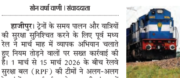
सोन वर्षा वाणी । संवाददाता

हाजीपुर। ट्रेनों के समय पालन और यात्रियों की सुरक्षा सुनिश्चित करने के लिए पूर्व मध्य रेल ने मार्च माह में व्यापक अभियान चलाते हुए नियम तोड़ने वालों पर सख्त कार्रवाई की है। 1 मार्च से 15 मार्च 2026 के बीच रेलवे सुरक्षा बल (RPF) की टीमों ने अलग-अलग रेलखंडों पर कार्रवाई करते हुए बड़ी संख्या में लोगों को हिरासत में लिया। रेल प्रशासन के अनुसार, बिना किसी उचित कारण के चैन पुलिंग कर ट्रेनों को अनावश्यक रूप से रोकने की घटनाओं को गंभीरता से लेते हुए "ऑपरेशन समय पालन" चलाया गया। इस अभियान के तहत कुल 514 लोगों को हिरासत में लिया गया और उनसे करीब 1 लाख 46 हजार रुपये जुर्माने के रूप में वसूले गए। इन सभी के खिलाफ रेल अधिनियम की धारा 141 के तहत