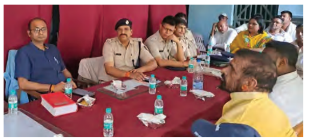
सोन वर्षा वाणी । संवाददाता