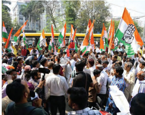
सोन वर्षा वाणी । संवाददाता

कार्रवाई की गई है। विभिन्न मंडलों में हुई कार्रवाई में दानापुर मंडल में सबसे अधिक 230 लोग पकड़े गए। इसके अलावा समस्तीपुर मंडल में 101, पं. दीन दयाल उपाध्याय मंडल में 73, सोनपुर मंडल में 66 और धनबाद मंडल में 44 लोगों को हिरासत में लिया गया। वहीं महिलाओं की सुरक्षा को ध्यान में रखते हुए "ऑपरेशन महिला सुरक्षा" भी चलाया गया। इस अभियान के तहत महिला कोच