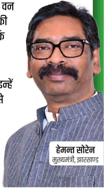
हेमन्त सोरेन मुख्यमंत्री, झारखण्ड

वन, पर्यावरण एवं जलवायु परिवर्तन विभाग, झारखण्ड