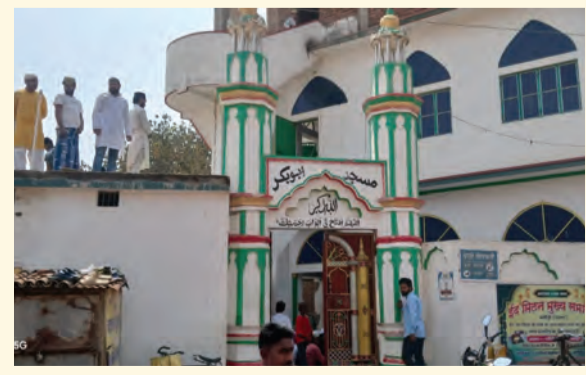
सोन वर्षा वाणी | संवाददाता

मसौढ़ी। रमजान के मुकद्दस महीने के आखिरी शुक्रवार 'अलविदा जुम्मा' के मौके पर मसौढ़ी अनुमंडल में आस्था और अकीदत का अद्भुत नजारा देखने को मिला। शहर से लेकर ग्रामीण इलाकों तक मस्जिदों में नमाजियों की भारी भीड़ उमड़ी और हर ओर इबादत का माहौल बना रहा। सुबह से ही लोग नए कपड़े पहनकर मस्जिदों की ओर बढ़ते नजर आए, जिससे पूरे क्षेत्र में धार्मिक उत्साह झलकता रहा। जामा मस्जिद रहामतगंज, पुरानी बाजार मस्जिद, तारंगना, कैलुचक, कश्यमीगंज समेत पुनपुन और धनरूआ प्रखंड के विभिन्न गांवों की मस्जिदों में