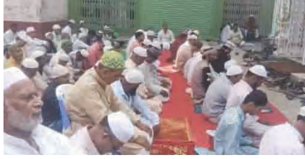
एसवीवी संवाददाता | औरंगाबाद

जिले में ईद का पर्व पूरे हर्षोल्लास, उमंग और उत्साह के साथ मनाया गया। सुबह होते ही शहर का माहौल त्योहार की खुशियों से सराबोर हो उठा। लोग नए-नए परिधानों में सज-धजकर मस्जिदों और ईदगाहों की ओर नमाज अदा करने के लिए निकल पड़े। शहर के जामा मस्जिद, पदान टोली, ईदगाह और नूरी मस्जिद सहित कुल 17 स्थानों पर बड़ी संख्या में नमाजियों ने अकीदत के साथ ईद की विशेष नमाज अदा की। नमाज के दौरान लोगों ने देश और दुनिया में अमन-चैन, भाईचारे और खुशहाली की दुआ मांगी। विशेष रूप से ईदगाह में सेकड़ों की संख्या में नमाजी एकत्रित हुए, जहां इमाम ने मुल्क की तरक्की, आपसी सौहार्द और शांति के लिए विशेष दुआ कराई। नमाज के बाद सभी ने हाथ उठाकर देश की सलामती और समाज में भाईचारे की मजबूती की कामना की। नमाज के उपरांत लोगों ने एक-दूसरे को गले लगाकर ईद की मुबारकबाद दी और मिठाइयां खिलाकर खुशियां साझा कीं। इस मौके पर हिन्दू समुदाय के