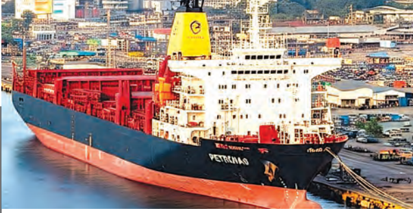
भारत कच्चे तेल का दूसरा सबसे बड़ा आयातक

सूत्रों के अनुसार, विदेश मंत्रालय, वाणिज्य एवं उद्योग मंत्रालय और पेट्रोलियम और प्राकृतिक गैस मंत्रालय के बीच उच्च-स्तरीय समन्वय स्थापित किया गया है। इसके तहत भारत अपनी 85-88 प्रतिशत आयात निरभरता को रूस, अमेरिका, नाइजीरिया, पश्चिम अफ्रीका और लैटिन अमेरिका जैसे गैर-खाड़ी स्रोतों से पूरा करने की दिशा में तेजी से आगे बढ़ रहा है। रणनीति के तहत रूस से बड़े पैमाने पर कच्चे तेल की खरीद फिर बढ़ सकती है। जानकारी के मुताबिक, अमेरिका द्वारा हाल ही में 30 दिनों की विशेष छूट दिए जाने के बाद भारत रूसी तेल के समुद्री कार्गो की तेजी से खरीद कर रहा है। वहीं नाइजीरिया और अंगोला जैसे पश्चिम अफ्रीकी देशों से भी सीधी आपूर्ति बढ़ाने के लिए भारतीय रिफाइनरियां—जैसे रिलायंस और एचपीसीएल—सक्रिय