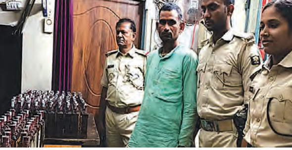
निज संवाददाता | हसपुरा (औरंगाबाद)

हसपुरा थाना पुलिस ने गश्ती के दौरान बड़ी कार्रवाई करते हुए अंग्रेजी शराब की खेप के साथ एक टेम्पो चालक को गिरफ्तार किया है। यह कार्रवाई च्युनाथपुर रोड स्थित किसुनपुर गांव जाने वाली सड़क पर की गई, जहां पुलिस ने सूचना के आधार पर वाहन को रोककर तलाशी ली और