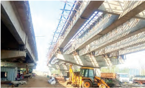
फ्लाईओवर का 40% काम बचा हुआ है। एनएचआइ के अधिकारियों के उदासीन रवैयें के कारण निर्माण