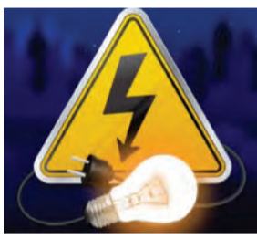
सोन वर्षा वाणी | संवाददाता

आरा। आरा में आज (23 मार्च 2026) पांच घंटे तक बिजली कटेगी। पूर्व गुमटी PSS से सुबह 11:00 बजे से शाम 4:00 बजे तक सपनाई टप रहेगी। शटडाउन के दौरान मेटेनेस वर्क और खराब कनेक्टर्स को बदला जाएगा। साथ ही क्षेत्र के सभी पोल और जर्जर तार की भी मरम्मत की जाएगी। ताकि उपभोक्ताओं को बिजली से संबंधित कोई भी समस्या उत्पन्न न हो।