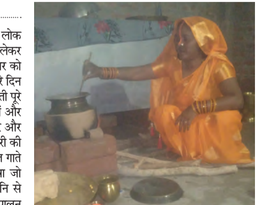
खरना का प्रसाद बनाती छठ व्रती

रजौली। रजौली मुख्यालय समेत प्रखंड क्षेत्र में लोक आस्था का महापर्व चार दिवसीय चैती महाछठ को लेकर श्रद्धालुओं में खासा उत्साह देखा जा रहा है। रविवार को नहाय-खाय के साथ पर्व की शुरुआत हुई, वहीं दूसरे दिन सोमवार को लोहंडा (खरना) के अवसर पर छठवती पूरे विधि-विधान से प्रसाद तैयार करते नजर आए। घरों और घाटों पर साफ-सफाई के बीच गुड़-चावल की खीर और रोटी बनाकर भगवान सूर्य को अर्पित करने की तैयारी की गई। इस दौरान छठवती महिलाएं पारंपरिक छठ गीत गाते हुए वातावरण को भक्तिमय बना रही हैं। "केलावा जो परलोक घवद से..." जैसे लोकगीतों की मधुर ध्वनि से पूरा इलाका गूंज उठा। श्रद्धालु व्रत के नियमों का पालन करते हुए 36 घंटे के निजंला उपवास की तैयारी में जुटे हैं। छठ व्रती मंगलवार को डूबते सूर्य, तो बुधवार को उगते सूर्य को अर्घ्य देकर व्रत की समाप्ति करेंगी। वहीं नगर पंचायत प्रशासन भी घाटों की सफाई और सुरक्षा व्यवस्था को लेकर सतर्क नजर आ रहा है, ताकि श्रद्धालु शांतिपूर्ण माहौल में पर्व संपन्न कर सकें। इस बार छठ व्रतियों के लिए रजौली नगर पंचायत द्वारा नीचे बाजार स्थित राज शिवालय मंदिर एवं पुरानी बस स्टैंड समेत