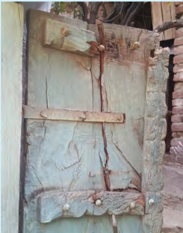
घर का टूटा हुआ दरवाजा