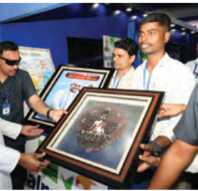
सोन वर्षा वाणी | संवाददाता

इसके उपरंत माननीय मुख्यमंत्री बस्तीपुर पहुंचे, जहां उन्होंने निर्माणधीन वाटर ट्रीटमेंट प्लांट के कार्यों का स्थलीय निरीक्षण किया। कार्यक्रम में माननीय मुख्यमंत्री ने विभिन्न विभागों द्वारा लाए गए विकाससात्मक योजनाओं से संबंधित स्टॉलों का भी निरीक्षण किया और योजनाओं के क्रियाचक्र की जानकारी प्राप्त की। उन्होंने लापुकों से संवाद करते हुए सरकार द्वारा चलाई जा रही योजनाओं के प्रभाव एवं लाभ के बारे में भी जानकारी ली। कार्यक्रम के दौरान माननीय मुख्यमंत्री ने रिमोट के माध्यम से जिले में कुल 158.59 करोड़ रुपये की लागत से पूर्ण हुई 179 योजनाओं का उद्घाटन किया। साथ ही 321.5 करोड़ रुपये की लागत से प्रस्तावित