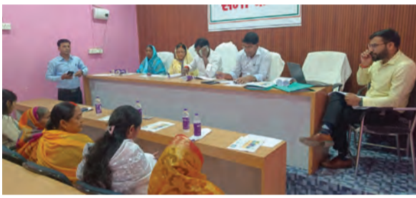
चर्चा के दौरान बोडीओ व ग्राम निर्माण मंडल के लोगों के साथ गणमान्य लोग

जन-कल्याणकारी कार्यक्रम नवादा जिले के चार प्रमुख प्रखंडों— रजौली, हिस्सा, नारीगंज और नवादा सरदर में सुचारू रूप से चलाया जा रहा है।