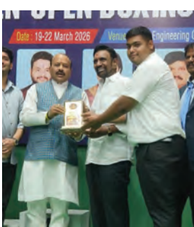
पुरस्कार प्राप्त करते रजौली के लाल

भोमावरम की रिंग में मिली राष्ट्रीय पहचान :- आंध्र प्रदेश के भोमावरम स्थित एसआरकेआर इंजीनियरिंग कॉलेज में बीते 19 से