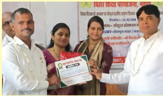
फोटो- शिक्षककों को सम्मानित करते प्रधानाध्यापिका