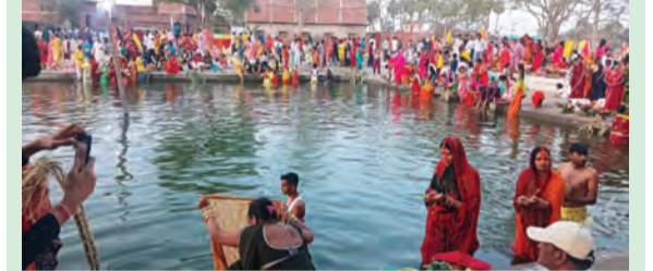
सोन वर्षा वाणी | संवाददाता

बिक्रमगंज / रोहतास : मंगलवार की संख्या को बिक्रमगंज और आसपास के प्रखंडों में छठ पूजा का पावन महापर्व श्रद्धालुओं की अपार श्रद्धा और उत्साह के साथ मनाया गया। घाटों पर भक्तों की भीड़, दीपों की चमक और पारंपरिक भजन-कीर्तन ने पूरे माहौल को भक्तिभावपूर्ण और दिव्य बना दिया। इस वर्ष भी बिक्रमगंज मुख्यालय काशी छठ पूजा घाट, कस्तर महादेव छठ पूजा घाट, धनगाई छठ पूजा घाट, नोनहर छठ पूजा घाट, सूर्यपुरा छठ पूजा घाट, नगर परिषद बिक्रमगंज वार्ड संख्या 21 धारूपुर मां काली छठ पूजा घाट, दिनारा प्रखंड के शक्तिपीठ निज धाम श्री यक्षिणी भुलुनी भवानी छठ पूजा घाट, काराकाट प्रखंड के काराकाट बाजार स्थित सूर्य मंदिर छठ पूजा घाट, मोथा सूर्य मंदिर छठ पूजा घाट, देवस्थली देव मारकंडेय सूर्य मंदिर छठ पूजा घाट और गुजुर सूर्य मंदिर छठ पूजा घाट समेत पूरे क्षेत्र के सभी प्रमुख घाटों पर श्रद्धालुओं ने भगवान सूर्य को पहला अर्घ्य अर्पित किया। संख्या अस्ताचलगामी समय पर घाटों का दृश्य अत्यंत मनोहारी था। महिलाएं अर्पण करती व्रत परिधान में सज-धज कर घाटों