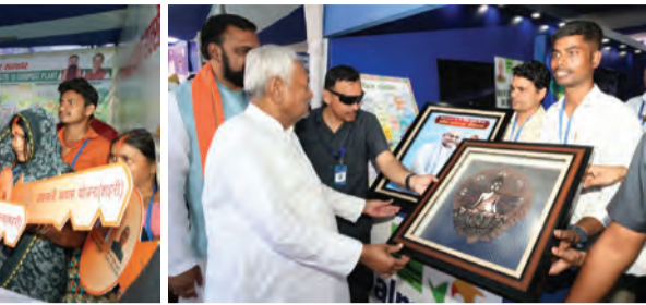
सोन वर्षा वाणी | संवाददाता

निर्माणधीन वाटर ट्रीटमेंट प्लांट के इंटेक वेल निर्माण स्थल का निरीक्षण किया। निरीक्षण के दौरान मुख्यमंत्री ने कार्य की गुणवत्ता एवं गति का जायजा लिया और इसे निर्धारित समयसीमा के भीतर पूर्ण करने का निर्देश दिया। मुख्यमंत्री जी ने सोन नदी में प्रस्तावित WEIR निर्माण स्थल का भी निरीक्षण किया। उन्होंने परियोजना से संबंधित तकनीकी पहलुओं की जानकारी ली तथा जल संरक्षण एवं आपूर्ति को सुदृढ़ बनाने में इस योजना की महत्ता पर बल दिया। साथ ही उन्होंने वाटर ट्रीटमेंट प्लांट के 3D मॉडल का अवलोकन कर परियोजना की रूपरेखा और उसके क्रियाचक्र की स्थिति का विस्तृत आकलन किया।