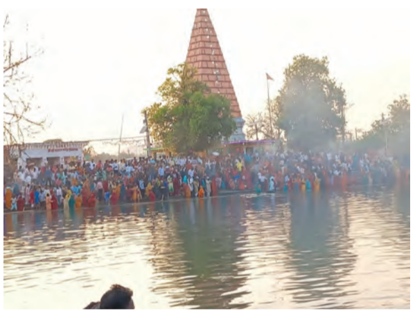
अस्ताचलगामी सूर्य देव को अर्घ्य देते छठव्रती

मंदिर कमिटी द्वारा साफ-सफाई और प्रकाश की विशेष व्यवस्था की गई है, जिससे श्रद्धालुओं को किसी प्रकार की असुविधा न हो। क्षेत्र के