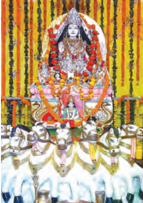
निज संवाददाता | नवीनगर (औरंगाबाद)