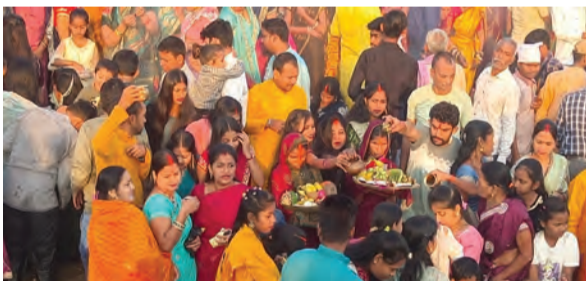
फोटो :- छठ व्रती को अर्घ्य देते श्रद्धालुगण

रजौली। रजौली नगर पंचायत समेत प्रखंड क्षेत्र में बुधवार की सुबह उगते सूर्य को अर्घ्य देने के बाद पारण के साथ लोक आस्था का महापर्व चार दिवसीय चैती महाछठ शांतिपूर्ण रूप से सम्पन्न हो गया। छठ के पहले दिन रविवार को नहाय-खाय के साथ पर्व की शुरुआत हुई, दूसरे दिन सोमवार को लोहंडा (खरना) के अवसर पर छठव्रती पूरे विधि-विधान से प्रसाद तैयार करते नजर आए। घरों और घाटों पर साफ-सफाई के बीच गुड़-चावल की खीर और रोटी बनाकर भगवान सूर्य को अर्पित करने की तैयारी की गई। इस दौरान छठव्रती