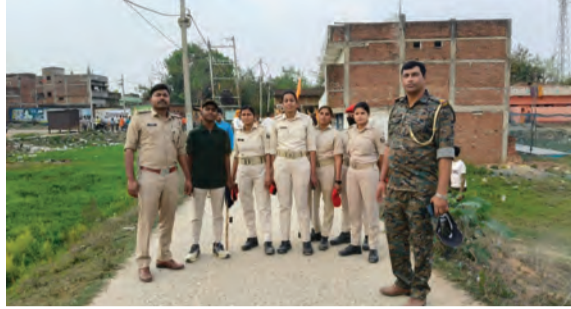
सोन वर्षा वाणी । संवाददाता

इमामगंज। प्रखंड में शुक्रवार को रामनवमी का पर्व आस्था, उत्साह और अनुशासन के साथ मनाया गया। कड़ी सुरक्षा व्यवस्था के बीच निकली भव्य शोभायात्रा ने पूरे क्षेत्र को रामयत्न कर दिया। हर ओर "जय श्रीराम" और "बजरंगबली की जय" के उद्घोष से वातावरण भक्तिमय हो उठा।