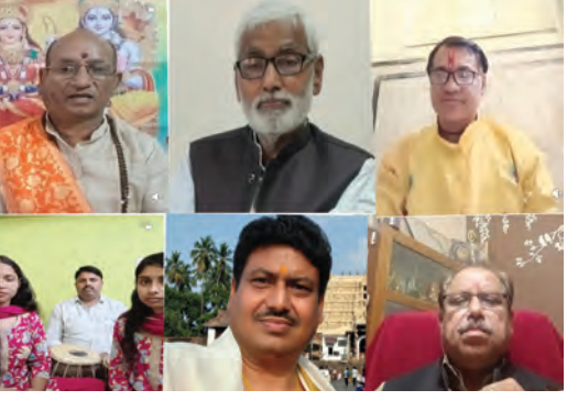
एसवीवी संवाददाता | औरंगाबाद

हुर बताया कि अनुष्ठान के दौरान देशभर के विद्वानों ने लयबद्ध तरीके से सुंदर कांड का पाठ किया। इसके बाद उन्होंने रामकथा का रसपूर्ण वर्णन करते हुए भक्ति की महिमा पर प्रकाश डाला और कहा कि रामचरितमास जीवन को सही दिशा देने वाला दिव्य ग्रंथ है। कार्यक्रम में बिक्रम, चतरा, गया, गोंडा, गोरखपुर, हजारीबाग, अयोध्या और जयपुर सहित विभिन्न स्थानों से आए विद्वानों ने सुंदर कांड का पाठ किया। मंच