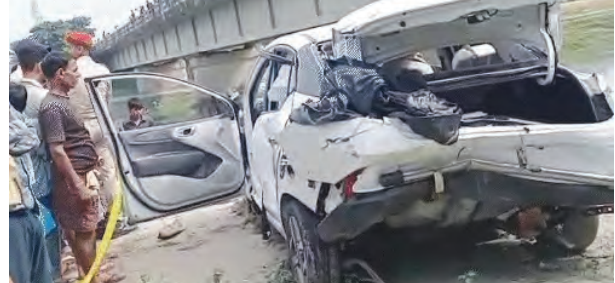
निज संवाददाता | मधेपुरा

सड़क हादसा : मेला देखकर लौट रहे तीन दोस्तों की मौत, एक लापता