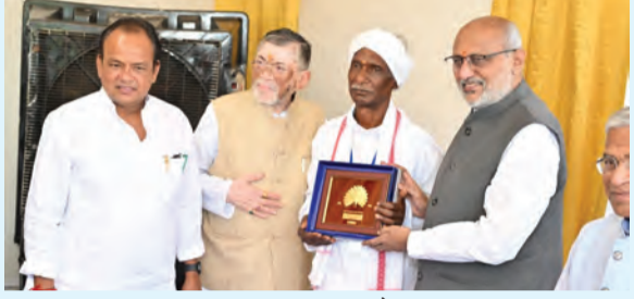
बिरसा मुंडा के वंशजों से मुलाकात

उपराष्ट्रपति सीपी राधाकृष्णन शनिवार को झारखंड के खूटी जिले स्थित भगवान बिरसा मुंडा की जन्मस्थली उलिहातु पहुंचे। उनके साथ झारखंड के राज्यपाल संतोष कुमार गंगवार भी मौजूद रहे। उपराष्ट्रपति और राज्यपाल ने उलिहातु पहुंचकर भगवान बिरसा मुंडा की प्रतिमा पर माल्यार्पण कर श्रद्धांजलि अर्पित की। इसके बाद उन्होंने