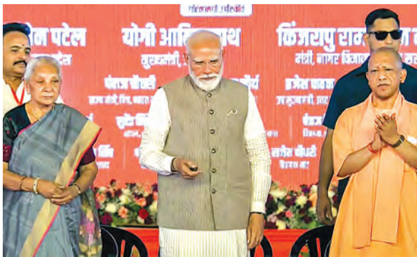
एयरपोर्ट सिर्फ एक सामान्य सुविधा नहीं

नरेन्द्र मोदी ने शनिवार को नोएडा अंतरराष्ट्रीय विमान पतन का भव्य उद्घाटन करते हुए इसे भारत के बुनियादी ढांचे और आर्थिक प्रगति की दिशा में एक ऐतिहासिक कदम बताया। उन्होंने कहा कि यह परियोजना केवल एक एयरपोर्ट नहीं, बल्कि "विकसित उत्तर प्रदेश, विकसित भारत" के विजन को साकार करने की दिशा में मील का पत्थर है। प्रधानमंत्री ने इस अवसर को अपने लिए विशेष बताते हुए कहा कि उन्हें इस एयरपोर्ट की नींव रखने और अब इसके उद्घाटन का अवसर मिला, जो उनके लिए गर्व की बात है। प्रधानमंत्री ने कहा कि उत्तर प्रदेश जैसे विशाल राज्य में अंतरराष्ट्रीय हवाई अड्डों की बढ़ती संख्या न केवल क्षेत्रीय संतुलित विकास को गति देगी, बल्कि निवेश, उद्योग और पर्यटन को भी नई ऊर्जा प्रदान करेगी। उन्होंने कहा कि जेवर एयरपोर्ट उत्तर भारत के लिए एक बड़ा एंजिन बनाने की क्षमता रखता है, जो दिल्ली-एनसीआर के बढ़ते दबाव को कम करने के साथ-साथ अंतरराष्ट्रीय संपर्क को भी मजबूत करेगा। वैश्विक परिस्थितियों का उल्लेख करते हुए प्रधानमंत्री मोदी ने पश्चिम एशिया में एक महीने से अधिक समय से जारी युद्ध पर गहरी चिंता व्यक्त की। उन्होंने कहा कि इस संघर्ष के कारण पूरी दुनिया में अनिश्चितता और अस्थिरता का माहौल बना हुआ है। कई देशों में खाद्य सामग्री, पेट्रोलियम उत्पाद, गैस और उर्वरकों की आपूर्ति प्रभावित हुई है, जिससे कीमतों में उछाल और