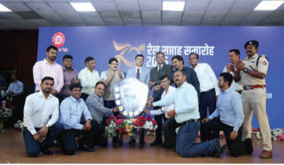
सोन वर्षा वाणी | संवाददाता

94 अधिकारियों-कर्मचारियों को मिला सम्मान, विभिन्न मंडलों को दक्षता एवं स्वच्छता शील्ड प्रदान