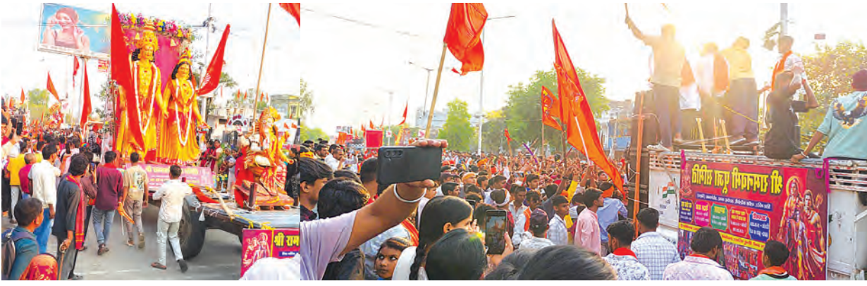
एसवीवी संवाददाता | औरंगाबाद

रामनवमी के अवसर पर शनिवार को औरंगाबाद शहर में भव्य और विशाल शोभायात्रा निकाली गई, जिसमें हजारों की संख्या में रामभक्त शामिल हुए। शहर का माहौल पूरी तरह भक्ति और उत्साह से सराबोर नजर आया। शोभायात्रा की शुरुआत सत्येंद्र नगर स्थित ब्लॉक कॉलोनी से हुई, जहां से बड़ी संख्या में महिला और पुरुष हाथों में ध्वज-पताका लेकर शामिल हुए। यह यात्रा महाराणा प्रताप चौक, रमेश चौक होते हुए धर्मशाला चौक तक पहुंची। रास्ते भर श्रद्धालुओं की भीड़ उमड़ी रही और जगह-जगह