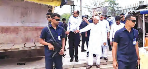
निज संवाददाता | पटना

पटना में निर्माणधीन योजनाओं का सीएम ने किया निरीक्षण, तेजी से काम पूरा करने का दिया निर्देश