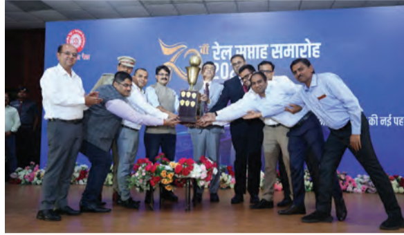
सोन वर्षा वाणी | संवाददाता

इस पावन यात्रा में कुल 321 कलश के साथ हजारों श्रद्धालुओं की भागीदारी रही। पूरे आयोजन के दौरान श्रद्धालुओं में उत्साह और