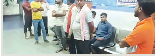
एसटीवी संवाददाता | औरंगाबाद