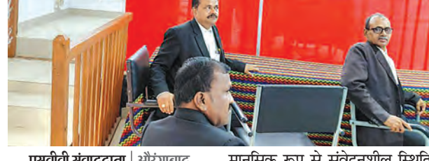
एसटीवी संवाददाता | औरंगाबाद

औरंगाबाद में न्याय व्यवस्था को अधिक संवेदनशील और पीड़ित-हितैषी बनाने की दिशा में एक महत्वपूर्ण कदम उठाया गया है। जिला विधिक सेवा प्राधिकार के संरक्षण में हाल ही में स्थापित कमजोर गवाह साक्ष्य केंद्र (भीडब्ल्यूडीसी) में गुरुवार को पहली बार एक कमजोर साक्षी का बयान दर्ज किया गया। अदालती सूत्रों के अनुसार, यह बयान अतिरिक्त जिला एवं सत्र न्यायाधीश (एडीजे-1) की देखरेख में दर्ज किया गया। इसके लिए विशेष रूप से सुरक्षित, बाल-मैत्रीपूर्ण और तकनीकी रूप से सुसज्जित वातावरण तैयार किया गया था, ताकि साक्षी बिना किसी भय या दबाव के अपना पक्ष रख सके। यह केंद्र खास तौर पर उन साक्षियों के लिए बनाया गया है, जो