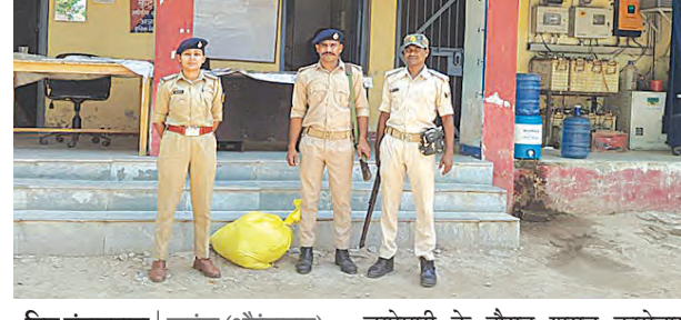
निज संवाददाता | कुटुंबा (औरंगाबाद)

जिले में अवैध शराब के खिलाफ चलाए जा रहे अभियान के तहत पुलिस को एक अरपलत्ता हाथ लगी है। गुप्त सूचना के आधार पर कार्रवाई करते हुए कुटुंबा थाना पुलिस ने थाना क्षेत्र के ग्राम कासीमपुर में छापेमारी कर 48 लीटर देशी शराब बरामद की है। पुलिस के अनुसार, इलाके में अवैध शराब के निर्माण और भंडारण की सूचना मिलने के बाद टीम ने तत्परता दिखाते हुए छापेमारी की। इस दौरान मौके से बड़ी मात्रा में देशी शराब जब्त की गई। हालांकि,