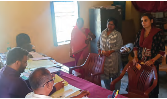
विद्यालय का निरीक्षण करते बीईओ