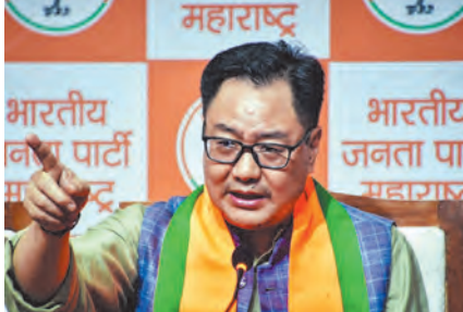
इस्तेमाल किया है। इसके विपरीत, उन्होंने जोर देकर कहा कि भाजपा के नेतृत्व में छोटे-छोटे समुदायों को भी समान महत्व दिया जाता है। रिजिजू ने न्यून एजेंसी एएनआई से कहा, 'इस बार केरल में चुनाव बहुत दिलचस्प है, क्योंकि पहली बार कांग्रेस और कम्युनिस्ट, दोनों ही बेनकाब हो गए हैं।' उन्होंने लंबे समय तक केरल के लोगों को बेवकूफ बनाया है। हर 5 साल में वे सत्ता बदलते

तिरुअनंतपुरम, एप्रैल 5। केरल विधानसभा चुनावों से पहले, केंद्रीय संसदीय कार्य मंत्री किरण रिजिजू ने शुक्रवार को सीपीआईएम के नेतृत्व वाले एनडीएफ और कांग्रेस के नेतृत्व वाले यूडीएफ, दोनों पर जमकर निशाना साधा। उन्होंने जोर देकर कहा कि पहली बार, कांग्रेस और कम्युनिस्ट, दोनों ही आम लोगों के सामने बेनकाब हो गए हैं। उन्होंने आरोप लगाया कि इन पार्टियों ने लंबे समय तक राज्य के लोगों को बेवकूफ बनाया। केंद्रीय मंत्री ने घोषणा की कि भाजपा और एनडीए ने केरल के भविष्य के लिए एक स्पष्ट नीति पेश की है। उन्होंने दावा किया कि कांग्रेस और कम्युनिस्ट, विदेशी अंशदान (विनियमन) अधिनियम के बारे में जनता को गुमराह कर रहे हैं और झूठी बातें फैला रहे हैं। केंद्रीय मंत्री ने यह भी आरोप लगाया कि कांग्रेस पार्टी ने ऐतिहासिक रूप से मुस्लिम समुदाय को केवल एक 'वोट बैंक' के तौर पर