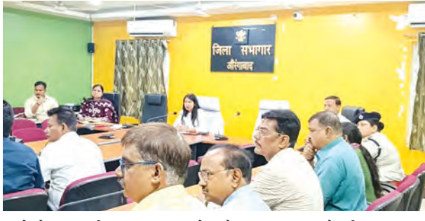
करने के साथ ही खराब चापाकलों की मरम्मत प्रारंभिकता के आधार पर करने और आवश्यकतानुसार डीप बोरिंग व पाइपलाइन से जलापूर्ति करने को कहा गया। नगर परिषद, औरंगाबाद ने बताया कि शहर में 13 टैंकर उपलब्ध हैं और आवश्यकता पड़ने पर अतिरिक्त टैंकर किराये पर लिए जाएंगे। गांधी मैदान स्थित निर्माणधीन आश्रय स्थल को जल्द पूरा करने का भी निर्देश दिया गया। वहीं नगर पंचायत नवीनगर में 33 नल-जल योजनाओं, 12 चापाकलों, 28 प्याऊ, 14 आरओ फिल्टर और टैंकों के माध्यम से जल आपूर्ति की जा रही है। देव नगर पंचायत में 11 वार्डों के 18 स्थानों पर स्टैंड पोस्ट प्याऊ संचालित हैं और 154 चापाकलों की मरम्मत की जा चुकी है, जबकि बारूण और रफीगंज में भी प्याऊ और टैंकर के जरिए पानी उपलब्ध कराने की व्यवस्था की गई है। पीएचईडी विभाग के अनुसार जिले

पेयजल संकट से निपटने के लिए सभी कार्यपालक पदाधिकारियों से क्षेत्रवार जानकारी ली गई और निर्देश दिया गया कि जहाँ जरूरत हो वहाँ टैंकर, वाटर एटीएम और प्याऊ के माध्यम से पानी उपलब्ध कराया जाए। शहरी क्षेत्रों, स्लम इलाकों और सार्वजनिक स्थलों पर स्वच्छ पेयजल की व्यवस्था सुनिश्चित