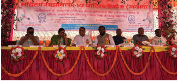
के साथ इस ऐतिहासिक पल का स्वागत किया।