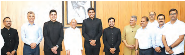
निज संवाददाता | पटना

सीएम ने वन सेवा प्रशिक्षुओं से की मुलाकात हरित आवरण बढ़ाने पर दिया विशेष जोर