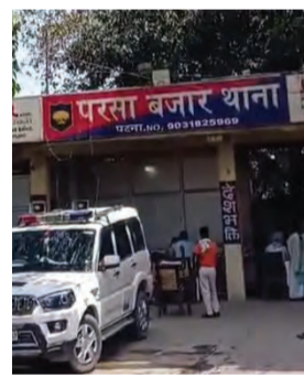
सोन वर्षा वाणी | संवाददाता

पटना। पटना के परसा बाजार थाना क्षेत्र में 22 वर्षीय चाचा पर अपनी तीन वर्षीय भतीजी के साथ सामूहिक दुष्कर्म करने का आरोप लगा है। इस घटना में उसके दो दोस्त भी शामिल बताए जा रहे हैं। पुलिस ने फौरन कार्रवाई करते हुए दो आरोपियों को गिरफ्तार कर लिया है। वहीं, तीसरा आरोपी फरार बताया जा रहा है, जिसकी गिरफ्तारी के लिए छापेमारी की जा रही है।