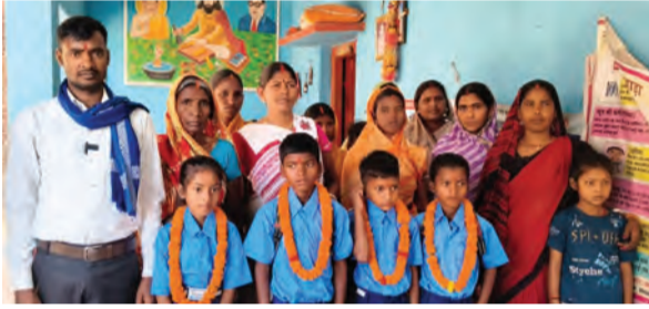
स्कूल में दाखिला के लिए जाते बच्चे