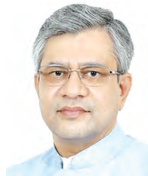
निज संवाददाता | पटना

रेल मंत्री ने सुरक्षा, प्रदर्शन और भीड़ प्रबंधन के क्षेत्र में हुए सुधारों पर संतोष जताते हुए बताया कि पिछले वर्ष दुर्घटनाओं में ऐतिहासिक कमी आई है और माल ढुलाई में रिकॉर्ड वृद्धि दर्ज की गई है। त्योहारों के दौरान विशेष ट्रेनों के सफल संचालन की सराहना करते हुए उन्होंने कहा कि