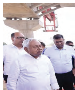
निज संवाददाता | पटना

बिहार में इंफ्रास्ट्रक्चर विकास को गति देने के उद्देश्य से मुख्यमंत्री नीतीश कुमार ने शनिवार को दानापुर-बिहटा एलिवेटेड कॉरिडोर और बिहटा एयरपोर्ट परियोजना का निरीक्षण किया। इस दौरान उन्होंने अधिकारियों को निर्माण कार्य में तेजी लाने के साथ-साथ गुणवत्ता बनाए रखने के सख्त निर्देश दिए।