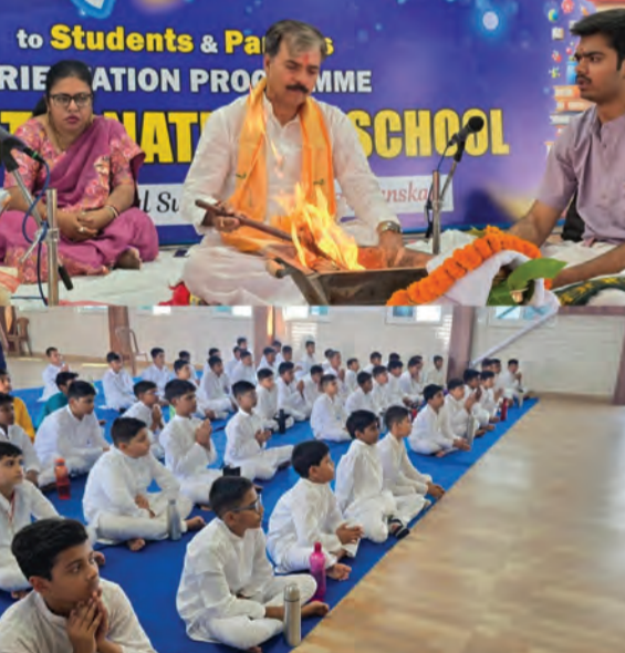
सोन वर्षा वाणी | संवाददाता

पटना। राजधानी स्थित गोल एजुकेशन विलेज परिसर में पारंपरिक विधि-विधान, वैदिक मंत्रोच्चारण और आध्यात्मिक वातावरण के बीच विद्यार्थ संस्कार का भव्य आयोजन किया गया। इस अवसर पर गोल इंटरनेशनल स्कूल के नवप्रवेशी विद्यार्थियों ने पूरे उत्साह और श्रद्धा के साथ भाग लेकर अपनी शैक्षणिक यात्रा की औपचारिक शुरुआत की। कार्यक्रम में अभिभावकों की भी उल्लेखनीय उपस्थिति रही, जिससे माहौल और अधिक उत्साहपूर्ण बन गया। कार्यक्रम की शुरुआत विधिवत पूजा-अर्चना और वैदिक मंत्रोच्चारण के साथ हुई। गुरुजनों के मार्गदर्शन में विद्यार्थियों ने अक्षरारंभ की प्रक्रिया पूरी की और शिक्षा के प्रति समर्पण, अनुशासन, परिश्रम और उत्कृष्टता का संकल्प लिया। इस दौरान पूरे परिसर में भारतीय संस्कृति, परंपरा और मूल्यों की झलक देखने को मिली, जिससे वातावरण अत्यंत प्रेरणादायक और सकारात्मक बना रहा। इस अवसर पर संस्थान के