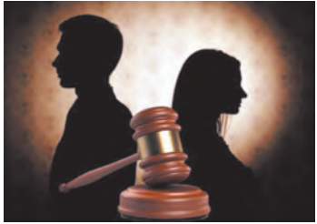
बनाया। सुप्रीम कोर्ट ने पहले दोनों पक्षों को सुना और फिर उनके बीच बातचीत के अपसी सहमति से तलाक लेने की प्रक्रिया शुरू की जाए। गुरुवार को सुप्रीम कोर्ट ने आदेश जारी करते हुए कहा कि दोनों पक्षों के बीच एलिमनी को लेकर

नई दिल्ली, एप्रैल 5। सुप्रीम कोर्ट ने एक साथ देशभर की अदालतों में चल रहे 61 मुकदमों पर रोक लगाते हुए एक दंपती को तलाक की मंजूरी दे दी है। 1994 से चल रहे तलाक मुकदमे को सुप्रीम कोर्ट ने अंजाम तक पहुंचा दिया। जस्टिस बीवी नागरत्ना और उज्वल भुयान की बेंच ने संविधान के अनुच्छेद 142 का इस्तेमाल करते हुए लंबे समय से अलग रह रहे पति-पत्नी के तलाक को मंजूरी दे दी। यह केस अवमानना के रूप में सुप्रीम कोर्ट पहुंचा था। हालांकि इसी की साल जनवरी-फरवरी में सुनवाई के दौरान सुप्रीम कोर्ट ने दोनों पक्षों को सुनने के बाद इसे अंतिम मोड़ देने का विचार