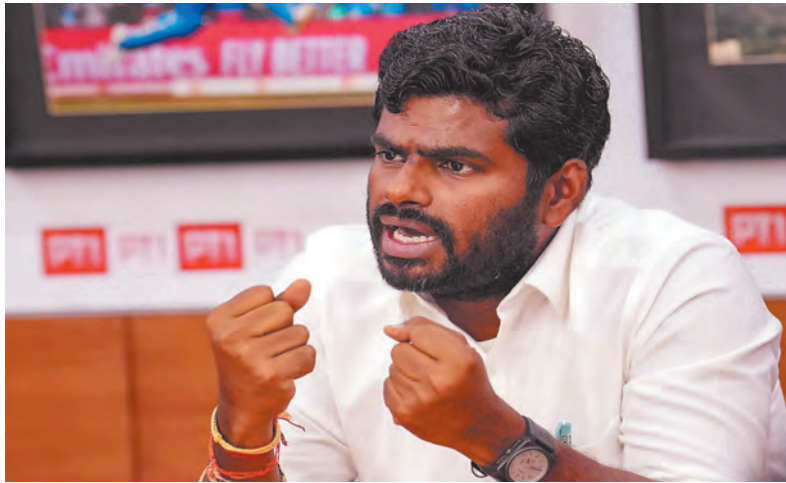
वनथी श्रीनिवासन को उनकी मौजूदा सीट से हटाया है। पार्टी ने सामाजिक समीकरणों को कोयंबटूर उतर और भाजपा के प्रदेश अध्यक्ष वनथी श्रीनिवासन को सत्तर सीट से चुनाव मैदान में उतारा है। पार्टी ने सामाजिक समीकरणों को साधते हुए 5 महिलाओं को भी चुनावी टिकट दिया है।

चेन्नई, एप्रैल 5। तमिलनाडु विधानसभा चुनाव के लिए भारतीय जनता पार्टी (भाजपा) ने अपनी रणनीति की बिसात बिछा दी है। पार्टी ने शुक्रवार को अपने हिस्से की सभी 27 सीटों के लिए उम्मीदवारों की सूची जारी कर दी, जिसमें केंद्रीय मंत्रियों से लेकर पूर्व राज्यपालों तक को चुनावी मैदान में उतारा गया है। हालांकि इस सूची में पार्टी के मुखर नेता और पूर्व प्रदेश अध्यक्ष के. अन्नामलाई का नाम शामिल था। इस घटना ने सियासी पंडितों को भी चौंका दिया। भाजपा ने अन्नाद्रमुक के नेतृत्व वाले राष्ट्रीय जनतांत्रिक गठबंधन में अपने कोटे की सीटों पर पूरी ताकत झोंक दी है। भाजपा ने अन्नामलाई को पूर्व केंद्रीय मंत्री एल मुरगन को उम्मीदवार बनाया है। वहीं, पूर्व राज्यपाल तमिलिसाई सुंदरराजन को मय्यलपुर, महिला मोर्चा की राष्ट्रीय अध्यक्ष