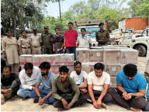
सोन वर्षा वाणी | संवाददाता

पटना। राजधानी के फुलवारीशरीफ इलाके में मद्य निषेध विभाग ने बड़ी कार्रवाई करते हुए अंतरराज्यीय शराब तस्करी गिरोह का भंडाफोड़ किया है। गौरीचक थाना क्षेत्र के मोहिउद्दीनपुर स्थित एक वेयरहाउस में छापेमारी कर टीम ने 8 तस्करों को गिरफ्तार किया, जबकि मौके से करीब साढ़े 8 लाख रुपये मूल्य की विदेशी शराब जब्त की गई। मद्य निषेध विभाग को गुप्त सूचना मिली थी कि उक्त वेयरहाउस में भारी मात्रा में शराब की खेप उतारी जा रही है। सूचना के आधार पर टीम गठित कर त्वरित छापेमारी की गई। कार्रवाई के दौरान एक ट्रक से विदेशी शराब उतारकर उसे पिकअप वैन में लोड किया जा रहा था, तभी टीम ने मौके पर दबिश देकर सभी आरोपियों को