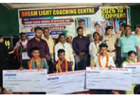
मंचासीन सम्मानित छात्र-छात्राएं एवं अतिथि