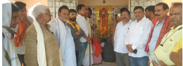
सोन वर्षा वाणी । संवाददाता

धूमधाम से भगवान परशुराम की मनाई गई जयंती