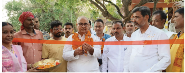
सोन वर्षा वाणी । संवाददाता

प्राथमिक विद्यालय मलपुरा में चारदीवारी का उद्घाटन, विधायक ने किया शुभारंभ