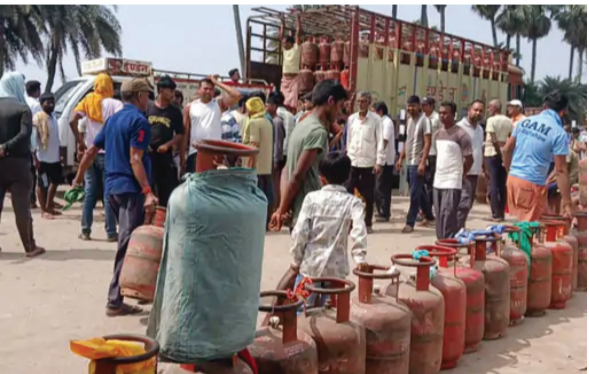
सोन वर्षा वाणी । संवाददाता

भागलपुर। भागलपुर के सुल्तानगंज शहर में पर्लू गैस सिलेंडर की किल्लत दूसरे दिन भी बनी रही, जिससे आम उपभोक्ताओं को भारी परेशानी का सामना करना पड़ा। रविवार को शहर के इंडिया अनुशास गैस गोदाम पर सुबह से ही सैकड़ों की संख्या में लोग गैस सिलेंडर लेने के लिए पहुंच गए और लंबी कतारें लग गईं। उपभोक्ता सुबह 9 बजे से ही तपती धूप में खड़े रहे, लेकिन पांच से छह घंटे बीत जाने के बावजूद अधिकांश लोगों को गैस सिलेंडर नहीं मिल सका। स्थिति तब और बिगड़ गई जब लंबे इंतजार के आने पर वितरण शुरू हुआ। इसके बावजूद कई लोगों को अब तक गैस नहीं मिल पाया है। शर्मों ने बताया कि अख्यवस्था से नाराज उपभोक्ताओं ने गोदाम परिसर में हंगामा शुरू कर दिया। स्थिति को संभालने के लिए डायल 112 की पुलिस टीम को बुलाना पड़ा। पुलिस के पहुंचने के बाद किसी तरह लोगों को शांत कराया गया और लाइन में लगे उपभोक्ताओं के बीच गैस वितरण की प्रक्रिया शुरू कराई गई। इसके बावजूद भी कई उपभोक्ता घंटों इंतजार के बाद खाली हाथ लौटने को मजबूर दिखे।