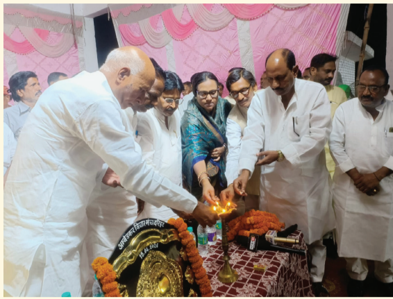
सोन वर्षा वाणी । संवाददाता

डिहरी (रोहतास)। जिले के डिहरी प्रखंड अंतर्गत दरिहत गांव में शनिवार 18 अप्रैल की रात को चैता गायन का जोरदार दु-गोला मुकाबला आयोजित किया गया। दुगोला महा मुकाबला कार्यक्रम में दो दिग्गज व्यासों के बीच देर रात तक चले सवाल-जवाब ने सैकड़ों श्रोताओं को बांधे रखा।