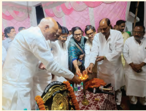
सोन वर्षा वाणी | संवाददाता

डिहरी(रोहतास)। जिले के डिहरी प्रखंड अंतर्गत दरिहत गांव में शनिवार 18 अप्रैल की रात को चैता गायन का जोरदार दु-गोला मुकाबला आयोजित किया गया।दुगोला महा मुकाबला कार्यक्रम में दो दिग्गज व्यक्तियों के बीच देर रात तक चले सवाल-जवाब ने सैकड़ों श्रोताओं को बांधे रखा।