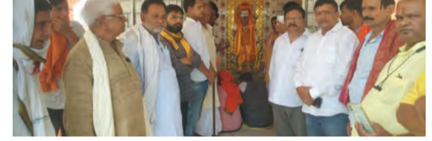
सोन वर्षा वाणी | संवाददाता

डेहरी /रोहतास। मानवता सेवा संघ के तत्वधान में मंगलपुर में धूमधाम से भगवान परशुराम जयंती मनाई गई।भगवान परशुराम के साधना स्थल माने जाने वाले रोहतास की धरती पर डेहरी अनुमंडल के मंगीतपुर में तथा बिक्रमगंज अनुमंडल के दिनारा में डिहरी अनुमंडल मुख्यालय में मनाया गया। मानवता सेवा संघ से जुड़े लोगों ने भगवान परशुराम की जयंती पर उनके उद्देश्य का अनुपालन करने का संकल्प लिया।भगवान परशुराम की मूर्ति पर पुष्पांजलि अर्पित किया गया। कार्यक्रम की अध्यक्षता रवि