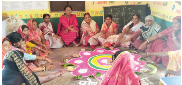
खेल खेल में बच्चों को शिक्षा देती सेविका