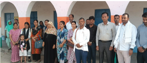
शोक सभा में शामिल शिक्षक एवं शिक्षिकाएं