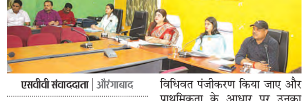
एसवीवी संवाददाता | औरंगाबाद

विधिवत पंजीकरण किया जाए और प्राथमिकता के आधार पर उनका शीघ्र एवं गुणवत्तापूर्ण निष्पादन सुनिश्चित किया जाए, ताकि किसी भी नागरिक को अनावश्यक विलंब का सामना न करना पड़े। समीक्षा के दौरान यह भी सामने आया कि कई मामलों में निस्तारण की प्रक्रिया में विलंब और समन्वय की कमी जैसी चुनौतियां हैं, जिन्हें दूर करने के लिए संबंधित पदाधिकारियों को सख्त निर्देश दिए गए। जिला पदाधिकारी ने सभी अधिकारियों को निर्देशित किया कि प्रत्येक परिवाद का निष्पक्ष, पारदर्शी और समयबद्ध तरीके से निपटारा किया जाए तथा लंबित मामलों के शीघ्र समाधान के लिए लगातार निगरानी और प्रयास जारी रखा जाए। जिला प्रशासन ने दोहराया कि आम नागरिकों की दैनिक समस्याओं का त्वरित समाधान सुनिश्चित करना है, जिससे प्रशासन अधिक संवेदनशील, पारदर्शी और जवाबदेह बन सके। उन्होंने स्पष्ट निर्देश दिया कि हर स्तर पर प्राप्त शिकायतों का