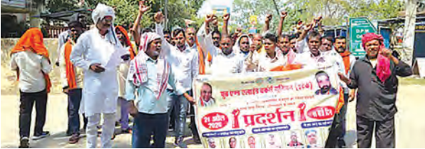
एसवीवी संवाददाता | औरंगाबाद

प्रखंड मुख्यालय स्थित एफसीआई गोदाम पर मंगलवार को श्रमिकों ने अपनी विभिन्न मांगों को लेकर जोरदार प्रदर्शन किया। यह प्रदर्शन खाद्य एवं संबद्ध श्रमिक संघ के बैनर तले आयोजित किया गया, जिसमें बड़ी संख्या में श्रमिकों ने भाग लेकर सरकार और गोदाम प्रबंधन के खिलाफ नारेबाजी की। प्रदर्शनकारी श्रमिकों ने आरोप लगाया कि वे वर्षों से राज्य खाद्य निगम के गोदामों में लोडिंग और अनलॉडिंग का कार्य कर रहे हैं, लेकिन उन्हें अब तक उनकी मेहनत के अनुरूप उचित मजदूरी नहीं मिल रही है। श्रमिकों का कहना है कि हाईकोर्ट के आदेश के अनुसार उन्हें प्रति यूनिट 11.67 रुपये का भुगतान किया जाना चाहिए, जबकि वर्तमान में मात्र 5.75 रुपये ही दिए जा रहे हैं, जो बेहद कम है और उनके श्रम का उचित मूल्य नहीं दर्शाता। श्रमिकों ने यह भी आरोप लगाया कि मजदूरी