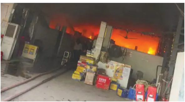
सोन वर्षा वाणी | संवाददाता

लगने का कारण शॉर्ट सर्किट प्रतीत हो रहा है। उन्होंने बैटरी गोदाम जैसे संवेदनशील स्थानों पर सुरक्षा मानकों के पालन की आवश्यकता पर जोर दिया, क्योंकि थोड़ी सी लापरवाही भी बड़े हादसे का कारण बन सकती है। इस घटना में लाखों रुपये मूल्य की बैटरियां और अन्य सामग्री जलकर नष्ट हो गईं।