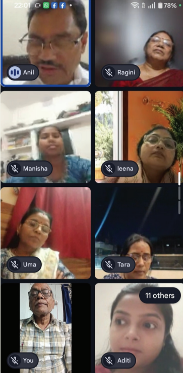
करने की जरूरत बताई।