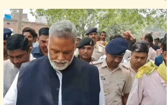
नेताओं और जनप्रतनियों के साथ मौजूद हैं, लेकिन उन पर कार्रवाई नहीं होती। भरे बयान को

से बिहार के पूर्व सीएम आते हैं, वहीं की एक बेटी को अब तक न्याय नहीं मिल पाया है। आरोपी खुलेआम घूम रहा है। उसे राजनीतिक संरक्षण प्राप्त है। ऐसे अपराधियों का बहिष्कार करें, वरना भविष्य में बेटियों का घर से निकलना मुश्किल हो जाएगा। यौन उत्पीड़न के वीडियो और साक्ष्य मौजूद: महिला सुरक्षा के मुद्दे पर पप्पू यादव ने कहा कि उनका संघर्ष उन नेताओं के खिलाफ है जो महिलाओं पर 'गिद्ध दृष्टि' रखते हैं। कई बड़े