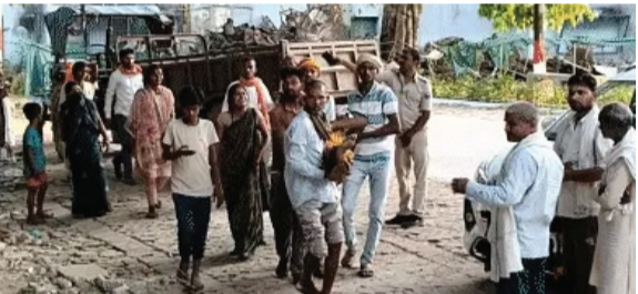
सोन वर्षा वाणी | संवाददाता

कहा- मेरी मौत के जिम्मेदार ससुराल वाले, भागकर ती थी शही