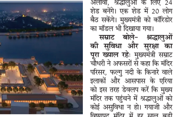
घाट का विकास, सीता कुंड क्षेत्र का विकास होगा।

गयाजी। गयाजी के विष्णुपद मंदिर कॉरिडोर में 694 स्ट्रक्चर बनेंगे। फल्यु नदी में भगवान विष्णु की 108 फीट ऊंची मूर्ति लगेगी। कॉरिडोर पर कुल 2390 करोड़ खर्च होंगे। बुधवार को मुख्यमंत्री सपाट चौधरी ने कॉरिडोर परियोजना की समीक्षा की। अफसरों को कई निर्देश दिए। समीक्षा बैठक में अफसरों ने मुख्यमंत्री को कॉरिडोर के बारे में बताया। अधिकारियों ने मुख्यमंत्री को बताया कि मंदिर कैम्पस और आसपास के इलाकों को विकसित किया जाएगा। मंदिर क्षेत्र में कॉमर्शियल शॉप, वाहन पार्किंग, श्रद्धालुओं-पिंडवातियों के लिए शौच, फल्यु नदी घाट का विकास, विष्णुपद मंदिर से मानपुर तक नदी