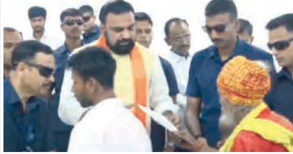
निज संवाददाता | पटना

सीएम ने जनता दरबार लगाकर आम लोगों की सुनी समस्याएं