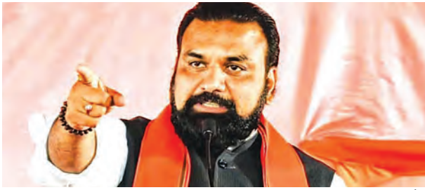
निज संवाददाता | पटना

अंचल एवं राजस्व अधिकारियों पर जनगणना कार्य में बाधा डालने के आरोप में जुर्माना लगाने की तैयारी हड़ताल पर गए अधिकारियों पर सरकारी, वेतन से होगी कटौती, 624 अधिकारियों पर कार्रवाई