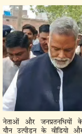
नेताओं और जनप्रतनधियों के साथ मौजूद हैं, लेकिन उन पर कार्रवाई नहीं होती। मेरे बयान को

से बिहार के पूर्व सीएम आते हैं, वहीं की एक बेटी को अब तक न्याय नहीं मिल पाया है। आरोपी खुलेआम घूम रहा है। उसे राजनीतिक संरक्षण प्राप्त है। ऐसे अपराधियों का बहिष्कार करें, वरना भविष्य में बेटियों का घर से निकलना मुश्किल हो जाएगा।