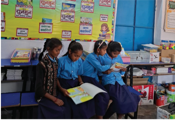
स्कूल स्थित पुस्तकालय में अध्ययनरत बच्चे