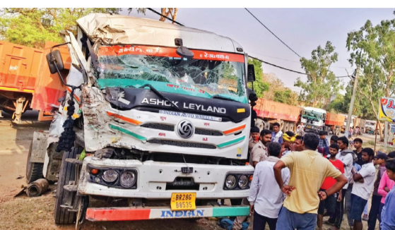
सोन वर्षा वाणी | संवाददाता

नासरीगंज (रोहतास)। डेहरी-बिक्रमगंज मुख्य मार्ग पर इट्टहा गांव के पास सोमवार को एक भीषण सड़क हादसे ने खुशियों भरी बारात को मातम में बदल दिया। बारात से लौट रही एक बस और हाईवा ट्रक के बीच आमने-सामने की जोरदार टक्कर