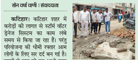
सोन वर्षा वाणी । संवाददाता

सांसद प्रतिनिधि ने कांग्रेस नेताओं के साथ मिलकर वॉटर ड्रेनेज सिस्टम कार्य का किया निरीक्षण