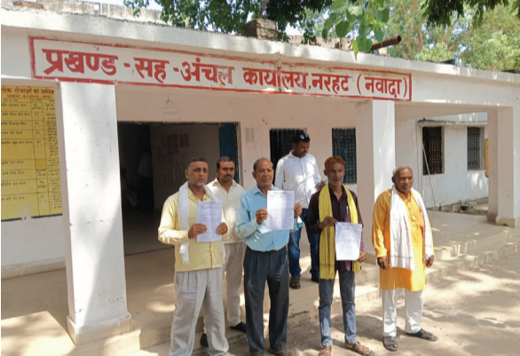
प्रखंड कार्यालय में आवेदन देते जदयू नेता एवं पंचायत समिति सदस्य