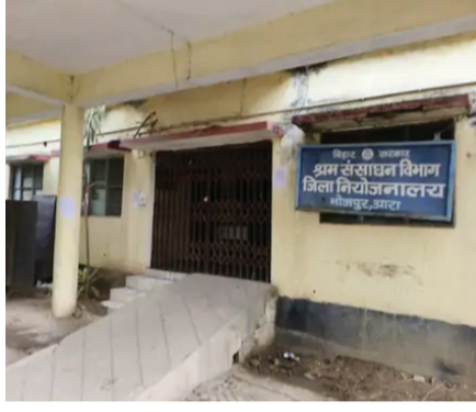
सोन वर्षा वाणी | संवाददाता

आरा। भोजपुर जिले के बेरोजगार युवाओं के लिए अच्छी खबर है। जिला नियोजनलय की ओर से कृषि विभाग, आरा कैम्प में आज(27 अप्रैल 2027) जॉब कैंप का आयोजन किया जा रहा है। निजी क्षेत्र की कंपनी एलाइट फूड्स प्राइवेट लाइटेड, होसूर बंगलुरु में ऑन-द-स्पॉट चयन किया जाएगा। कंपनी कुल 45 पदों पर भर्ती करेगी। प्रोडक्शन हेल्पर और पैकिंग हेल्पर के पदों पर ऑन द स्पॉट बहाली होगी। चयनित अभ्यर्थियों को 16,000 से 18000 रुपये तक का मासिक वेतन दिया जाएगा। कैम्प सुबह 11 बजे से शाम 4 बजे तक चलेगा। NCS पोर्टल पर रजिस्ट्रेशन जरूरी: पुरुष और