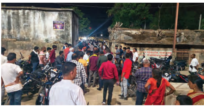
ग्रामीणों की लगी अस्पताल के समीप भीड़

75 बेड के अस्पताल और दामा सेंटर की खुली पोल, कागजों तक सीमित सरकारी दावे: रजौली का यह हादसे के तुरंत बाद स्थानीय ग्रामीणों और