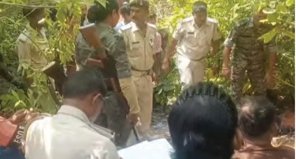
सोन वर्षा वाणी | संवाददाता

गयाजी। गयाजी में रामशिला पहाड़ी के नीचे झाड़ियों में एक युवक का शव मिला है। स्थानीय लोगों की सूचना पर पुलिस टीम मौके पर पहुंची। शव को कब्जे में लेकर पोस्टमार्टम के लिए भेज दिया गया है। मृतक की पहचान नहीं हो सकी है। घटना कोतवाली थाना क्षेत्र की है। पुलिस के अनुसार, प्रारंभिक जांच में मुक्तक के शरीर पर किसी बाहरी चोट या हिंसा के स्पष्ट निशान नहीं मिले हैं। स्थानीय लोगों ने बताया कि जिस स्थान पर शव मिला है, वह इलाका आमतौर पर सुनसान रहता है। पुलिस सभी संभावित पहलुओं से मामले की जांच कर रही है। ताकि मौत की वजह स्पष्ट हो सके। मृतक की पहचान के लिए आसपास के थानों और जिलों में सूचना भेजी गई है। साथ ही, पुलिस स्थानीय लोगों से भी पूछताछ कर रही है। गुप्तदगी की रिपोर्टों से मिलान कर जांच को आगे बढ़ाया जाएगा। पोस्टमार्टम के बाद डेड बॉडी को 72 घंटे तक सुरक्षित रखा जाएगा।