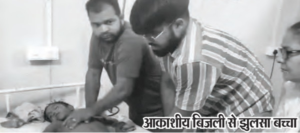
आकाशीय बिजली से झुलसा बच्चा