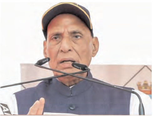
राजनाथ ने अनिश्चित सुरक्षा परिवेश में सतर्क रहने के महत्व पर बल देते हुए कहा कि मैंने हमेशा अपनी सशस्त्र सेनाओं और रक्षा विशेषज्ञों से एक ही बात कही है, और मैं आज इसे फिर से दोहराना चाहता हूँ कि हमें न केवल

सशस्त्र सेनाएं न केवल बदलावों को समझ रही हैं, बल्कि आत्मविश्वास के साथ उनका उपयोग भी कर रही हैं।