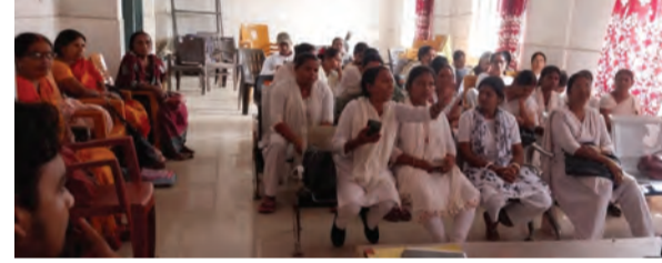
बैठक करते चिकित्सा प्रभारी, उपस्थित स्वास्थ्यकर्मियों