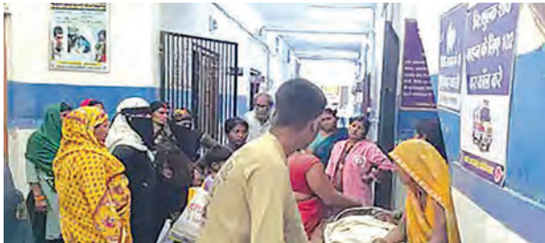
एसवीवी संवाददाता | औरंगाबाद