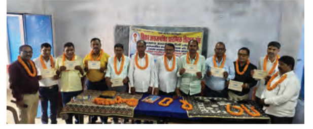
पूर्वों की माला पहने शिक्षक संघ के अध्यक्ष, सचिव व अन्य