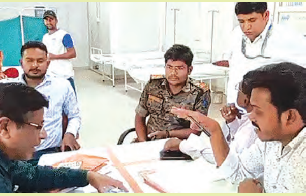
निज संवाददाता | मदनपुर (औरंगाबाद)

मदनपुर थाना क्षेत्र स्थित इंडियन बैंक में हुई घटना सिक्वोरिटी गार्ड से पुलिस कर रही पूछताछ