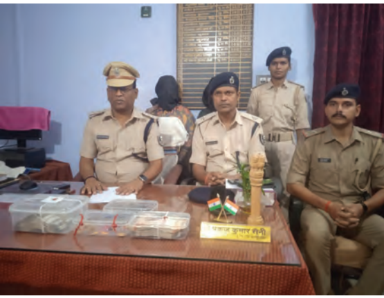
वारिसलीगंज थाना में गिरफ्तार महिला चोरों के साथ बरामद नकदी व जेवरात प्रदर्शित करते पुलिस पदाधिकारी।

पुलिस अधीक्षक, नवादा के निर्देश पर अनुमंडल पुलिस पदाधिकारी, पकरीबरावां के नेतृत्व