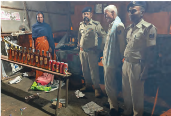
जन्त शराब व बियर के साथ गिरफ्तार महिला एवं उत्पाद बल