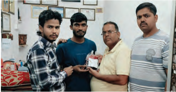
अस्पताल परिसर में डोनर के साथ समिति के लोग