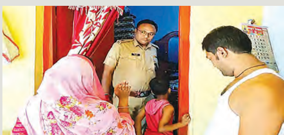
निज संवाददाता | दाउदनगर (औरंगाबाद)