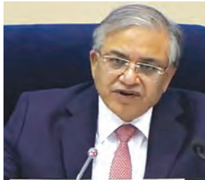
GYANESH KUMAR CHIEF ELECTION COMMISSIONER

भारत निर्वाचन आयोग ने गुरुवार को 16 राज्यों और तीन केंद्र शासित प्रदेशों में मतदाता सूचियों के विशेष गहन पुनरीक्षण (एसआईआर) के तीसरे चरण की शुरुआत करने की घोषणा की है। आयोग ने इसे देशव्यापी स्तर पर चलाया जाने वाला बड़ा अभियान बताया है, जिसका उद्देश्य मतदाता सूचियों को अधिक सटीक, पारदर्शी और सुदृढ़ बनाना है। निर्वाचन आयोग के अनुसार, तीसरे चरण का कार्यक्रम वर्तमान में चल रही जनगणना के मकान सूचीकरण कार्य में लगी साइड फील्ड मशीनरी की उपलब्धता को ध्यान में रखते हुए तैयार किया गया है। इस चरण की शुरुआत के साथ ही देश के अधिकांश हिस्सों में SIR प्रक्रिया लागू हो जाएगी।