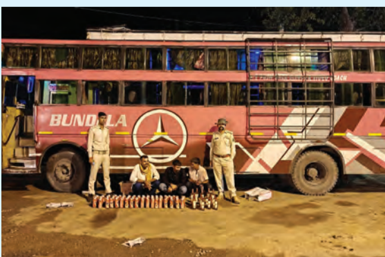
जब्त शराब व बस के साथ गिरफ्तार बस कर्मी