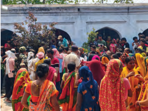
माध्यम से लूटने का षड्यंत्र रच रहे हैं।