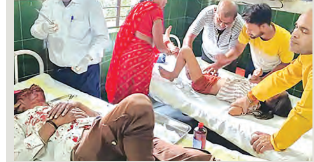
निज संवाददाता | ओबरा (औरंगाबाद)