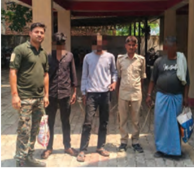
थाना परिसर से जेल जाते गिरफ्तार लोग