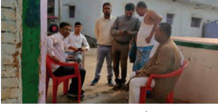
सोन वर्षा वाणी | संवाददाता

दूरी वाले स्कूलों में तेनात प्रगणकों को 12:30 बजे तक विद्यालय लौटने का दबाव, वरपूजा पर महिला शिक्षिकाओं की छुट्टी पर भी संकट