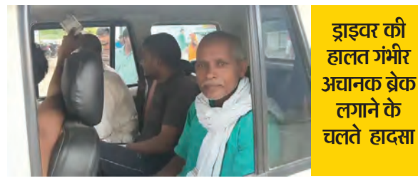
ड्राइवर की हालत गंभीर अचानक ब्रेक लगाने के चलते हादसा