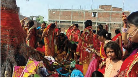
सोन वर्षा वाणी | संवाददाता

वट वृक्ष की पूजा-अर्चना कर सुहागिन महिलाओं ने मांगी परिवार की सुख-समृद्धि