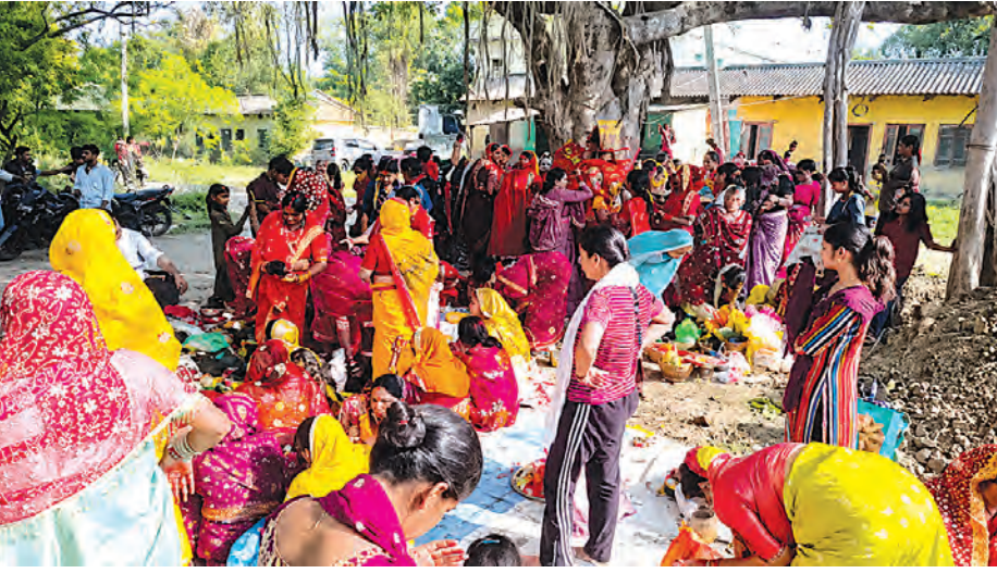
सुहागिन महिलाओं ने श्रद्धा और उल्लास के साथ वट सावित्री पूजा की।