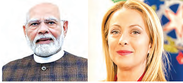
नरेंद्र मोदी, भारत के प्रधानमंत्री और जॉर्जिया मेलोनी, इटली गणराज्य मंत्रिपरिषद की अध्यक्ष

भारत और इटली के संबंध अब एक निर्णायक दौर में पहुंच चुके हैं। हाल के वर्षों में दोनों देशों के रिश्तों में अभूतपूर्व तेजी से विस्तार हुआ है। यह संबंध केवल सौहार्दपूर्ण मित्रता तक सीमित नहीं रहे, बल्कि अब स्वतंत्रता और लोकतंत्र के मूल्यों तथा भविष्य के साझा दृष्टिकोण पर आधारित एक विशेष रणनीतिक साझेदारी में बदल चुके हैं। ऐसे समय में, जब पूरी दुनिया की व्यवस्था बड़े बदलाव के दौर से गुजर रही है, इटली और भारत की साझेदारी उच्च राजनीतिक और संस्थागत स्तर पर लगातार संवाद से आगे बढ़ रही है। यह संबंध अब एक नए और अधिक व्यापक स्तर पर पहुंच रहा है, जिसमें दोनों देशों की आर्थिक ताकत, सामाजिक रचनात्मकता और हजारों वर्षों पुरानी सभ्यतागत विरासत शामिल है। हमारा सहयोग इस साझा समझ को दर्शाता है कि 21वीं सदी में समृद्धि और सुरक्षा इस बात पर निर्भर करेगी कि देश कितनी क्षमता से नवाचार करें, ऊर्जा परिवर्तन का प्रबंधन करें और अपनी रणनीतिक आत्मनिर्भरता को मजबूत करें। इसी उद्देश्य से हमने अपने द्विपक्षीय संबंधों को और गहरा तथा विविध बनाने का संकल्प लिया है, ताकि नए लक्ष्यों को हासिल किया जा सके और दोनों देशों की पूरक शक्तियों का बेहतर उपयोग हो सके। हम इटली की डिजाइन क्षमता, बेहतर विनिर्माण क्षमता और विश्वस्तरीय सुपरकंप्यूटर तकनीक-जो उसे एक औद्योगिक महाशक्ति बनाती है-को भारत की तेज आर्थिक वृद्धि, इंजीनियरिंग प्रतिभा, बड़े पैमाने की क्षमता, नवाचार और 100 से अधिक यूनिवर्सिटी तथा 2 लाख स्टार्ट-अप वाले उद्यमी इकोसिस्टम