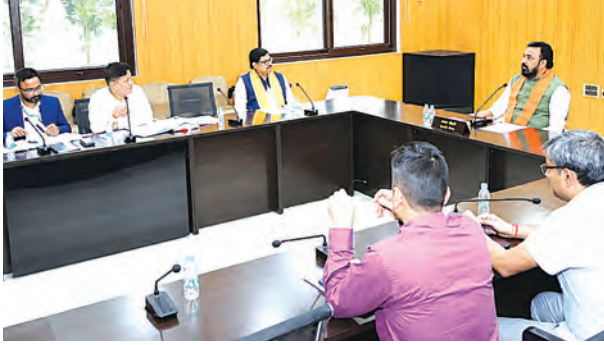
महिला और पुरुष शिक्षकों को गृह क्षेत्र में पोस्टिंग

बिहार में शिक्षक बनने की तैयारी कर रहे युवाओं और वर्तमान में कार्यरत शिक्षकों के लिए राज्य सरकार ने बड़ा ऐलान किया है। बिहार के मुख्यमंत्री सम्राट चौधरी ने शिक्षा विभाग की उच्चस्तरीय समीक्षा बैठक के बाद कई महत्वपूर्ण फैसलों की जानकारी दी। सरकार ने अगले पांच वर्षों में राज्यभर में एक लाख नए शिक्षकों की नियुक्ति करने का लक्ष्य तय किया है। साथ ही शिक्षकों के तबादले को लेकर भी नई नीति बनाने का निर्देश दिया गया है, जिससे उन्हें अपने गृह क्षेत्र के नजदीक पोस्टिंग मिल सके। मुख्यमंत्री ने बताया कि राज्य में गुणवत्तापूर्ण शिक्षा सुनिश्चित