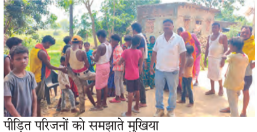
पीड़ित परिजनों को समझाते मुखिया