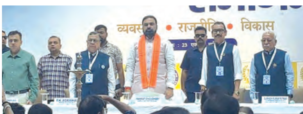
अब तंग होकर बिहार छोड़ने का नहीं, लौटने का दौर

सीएम सम्राट चौधरी ने उद्योग नीति पर बात करते हुए कहा कि सरकार केवल कामजो पर नहीं, बल्कि जमीन पर इंडस्ट्री खड़ी करने में विश्वास रखती है। उन्होंने उद्योग नीति 2025 में किए गए संशोधनों का जिक्र करते