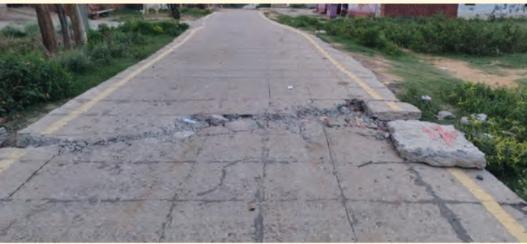
हरदिया सेक्टर-ए में टूटी ग्रामीण सड़क

में टूटकर बिखर रही है। जबकि सड़क लंबे समय तक सुरक्षित रहे, इसके लिए सड़क को छोटे-छोटे ब्लॉक में भी काटा गया था।