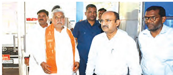
सफाई, दवाई, पेयजल, बिजली का जायजा लिया। निरीक्षण के क्रम में डॉ. प्रेम कुमार ने अस्पताल

बिहार विधानसभा अध्यक्ष डॉ. प्रेम कुमार ने रविवार को गया जिला अंतर्गत अनुग्रह नारायण मगध मेडिकल कॉलेज एवं अस्पताल, गयाजी का औचक निरीक्षण किया। निरीक्षण के दौरान उन्होंने अस्पताल में भर्ती मरीजों एवं उनके परिजनों से मिलकर उनका हाल-चाल जाना तथा अस्पताल परिसर में उपलब्ध