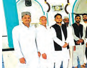
रफीगंज में अकीदत और भाईचारे के साथ मनाई गई बकरीद

रफीगंज शहर और आसपास के ग्रामीण क्षेत्रों में ईद-उल-अजहा (बकरीद) का पर्व पूरे उत्साह, अकीदत और भाईचारे के साथ मनाया गया। त्याग, समर्पण और अल्लाह के प्रति अटूट विश्वास का यह पर्व क्षेत्रभर में खुशियों और सौहार्द का संदेश लेकर आया। यह पालन एवं पैगंबर हजरत इब्राहिम अलैहिस्सलाम के महान बलिदान की याद में मनाया जाता है। इस्लामिक मान्यताओं के अनुसार, अल्लाह के आदेश पर उन्होंने अपने सबसे प्रिय पुत्र हजरत इस्माईल की कुर्बानी देने का निश्चय किया था। उनकी सच्ची नीयत और समर्पण को देखते हुए अल्लाह ने हजरत इस्माईल की जगह एक दुम्बा भेज दिया और उनकी कुर्बानी कुबूल की। यह घटना ईरान की नीयत, आस्था और समर्पण के महत्व को दर्शाती है। सुबह होते ही रफीगंज