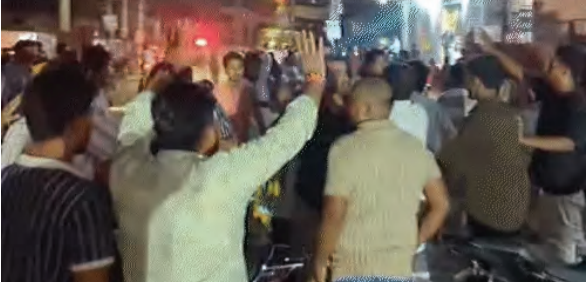
सोन वर्षा वाणी । संवाददाता

आरा । भोजपुर जिले के नवादा थाना क्षेत्र के पकड़ी गैस एजेंसी रोड स्थित एक निजी अस्पताल में ऑपरेशन के दौरान महिला की मौत के मामले में पुलिस ने डॉक्टर समेत चार लोगों के खिलाफ हत्या की प्राथमिकी दर्ज की है। वहीं अस्पताल में तलाशी के दौरान गांजा, जिंदा कारतूस और पहचान पत्र बरामद होने के बाद एक अस्पताल कर्मी पर आर्स एक्ट और एनडीपीएस एक्ट के तहत अस्पताल से मामला दर्ज किया गया है। घटना के बाद पुलिस पूरे मामले की गहन जांच में जुट गई है।