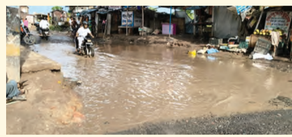
नरहट चांदनी चौक के पास जलजमाव में पार करता बाइक सवार

लोगों और दुकानदारों पर पड़ते हैं, जिससे लोगों में नाराजगी बढ़ रही है। स्थानीय लोगों का कहना है कि निर्माण एजेंसी की लापरवाही के कारण समस्या दिन-प्रतिदिन गंभीर होती जा रही है। ग्रामीणों ने बताया कि सड़क निर्माण कार्य लंबे समय