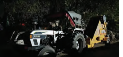
सोन वर्षा वाणी । संवाददाता

बक्सर । बक्सर में अवैध मिट्टी खनन के खिलाफ कार्रवाई करते हुए मुफरिस्सल थाना पुलिस ने भभुअर स्थित सरकारी पोखरे से एक रैपर मशीन और एक ट्रैक्टर जब्त किया है। पुलिस ने खनन विभाग को इसकी सूचना दे दी है। गुरुवार रात मुफरिस्सल थाना पुलिस को सूचना मिली थी कि भभुअर के सरकारी पोखरे से बड़े पैमाने पर अवैध मिट्टी का खनन किया जा रहा है। सूचना मिलते ही पुलिस टीम मौके पर पहुंची। पुलिस को देखते ही मौके पर मौजूद मिट्टी माफियाओं में अफरा-तफरी मच गई। कई ट्रैक्टर चालक अपने वाहन लेकर भागने में सफल रहे, लेकिन पुलिस ने एक ट्रैक्टर और मिट्टी काटने वाली रैपर मशीन को जब्त कर लिया।