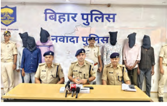
आधार पर पुलिस टीम द्वारा लगातार छापामारी की गई।

नवादा : बीते दिनों 20 मई को समय लगभग 12 :35 बजे हिसुआ थाना क्षेत्र अंतर्गत एक व्यक्ति बैंक ऑफ इंडिया, शाखा हिसुआ से 3,10,000/- (तीन लाख दस हजार रुपये) की निकाली कर गाड़ी की डिकी में रखकर अपने कार्यालय आ रहे थे, इसी क्रम में रास्ते में स्थित गंगदेव पेट्रोल पंप वालियरी स्थित खड़ी मोटर्सइंडियल की डिकी को खोलकर अज्ञात चोरों के द्वारा पैसों की चोरी की गई थी। इस संबंध में हिसुआ थाना कांड संख्या 268/26 दिनांक 20.05.2026 के तहत प्राथमिकी दर्ज किया गया। घटना की गंभीरता को देखते हुए हिसुआ थाना द्वारा त्वरित कार्रवाई करते हुए घटनास्थल एवं आसपास लगे सीसीटीवी कैमरों का अवलोकन किया गया। सीसीटीवी फुटेज के आधार पर एक संदिग्ध व्यक्ति को चिन्हित किया गया तत्पश्चात तकनीकी एवं मानवीय सूचना के